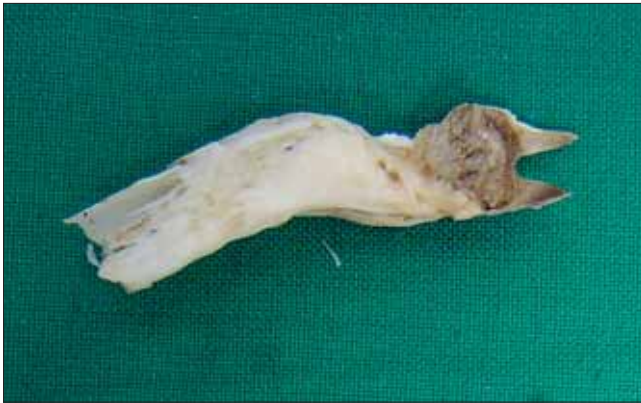
Slika 6. Osljedica tijekom rane faze rasta, sjekač Figure 6 Early trauma to the developing tooth, lower canine

cira dio već formiranog zuba te ošteti i zonu rasta neposredno ispod navedenog dijela zuba (slika 6). Učinak traume na zonu rasta može biti različit, ali uvijek na određeni način izaziva zastoje u rastu. Jedna od posljedica snažne traume i ujedno odraz velikog potencijala rasta ovih zuba, je i formiranje dvije zone rasta u vršnoj regiji brusaca, netom ispod zone intenzivnog taloženja zubnog cementa (Konjević i dr. 2004b).