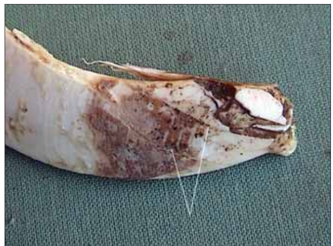
Slika 5. Zacijeljeni nepotpuni prijelom sjekača Figure 5 Healed incomplete fracture of the lower canine

Još jedna od mogućnosti je i trauma tijekom samog nastajanja zuba koja dovodi do jakog oštećenja zuba i posljedično iznimno nepravilnog rasta (Konjević i dr. 2006). Takav jaki udar prema svemu sudeći dislo-