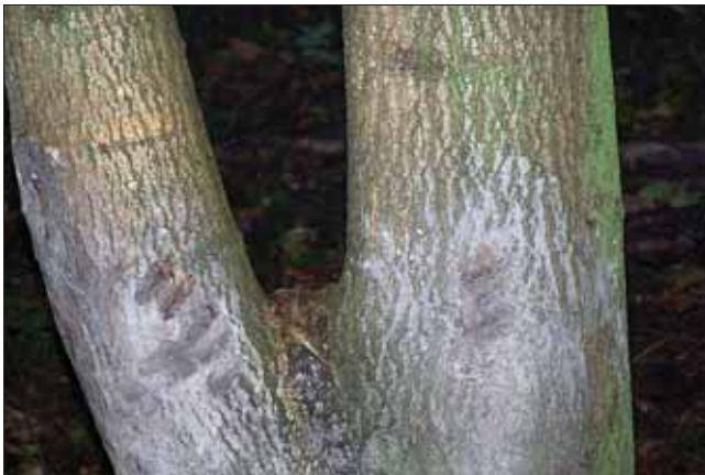
Slika 1. Divlje svinje kljovama i označuju vegetaciju

u gornjoj i u donjoj čeljusti, a nazivamo ih kljovama. Pri tome, sam pojam kljova zapravo i nije znanstveno određeni naziv, već naširoko korišteni pojam koji označava zube koji proviruju iz usne šupljine, a odlikuju se trajnim rastom (Steenkamp 2003). Tako primjerice kljove u afričkog ( Loxodonta africana ) i azijskog slona ( Elephas maximus ) čine sjekutići, vodenkonja ( Hippopotamus amphibius ) i sjekutići i očnjaci, a morža ( Odobenus rosmarus ) samo gornji očnjaci. Osim po položaju u usnoj šupljini, kljove se razlikuju i prema svojoj funkciji, a svakako svome vlasniku predstavljaju više od običnoga zuba. Potvrdu tome nalazimo u činjenici da slon primjerice vrlo često koristi kljove i kao naslon za surlu prigodom odmora (Steenkamp 2003). Divlje svinje rabe kljove tijekom razdoblja bucanja za borbu s drugim veprovima, za obranu od grabežljivaca, za označavanje drveća (slika 1), premiještanje raznih predmeta prilikom potrage za hranom i sl. S obzirom da se kljove