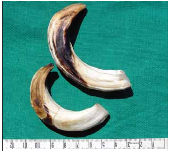
Slika 4. Na većem brusaaču nema brusne plohe Figure 4 Note the absence of the wetting surface on larger upper canine

nak brusne plohe, naime, znači da predmetni zub nije nikada bio u kontaktu s nasuprotnim, te je samim time izostalo i njegovo fiziološko trošenje (slika 4).