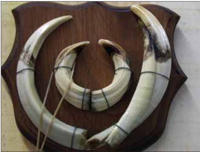
Slika 8. Prekobrojni sjekač, prikazano na 10. Nacionalnoj izložbi trofeja, Zagreb

Figure 8 Supernumerary lower canine, exhibited at 10th National Trophy Exhibition, Zagreb