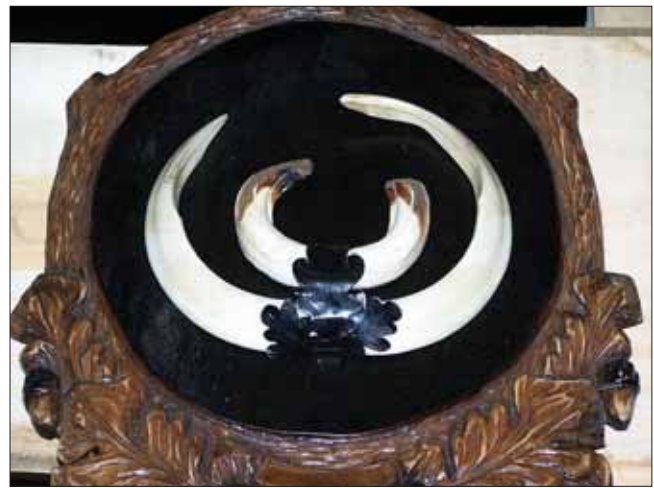
Slika 2. Prerasli sjekač, primjerak izložen na 10. Nacionalnoj izložbi trofeja, Zagreb

Kada govorimo o pregledu do sada uočenih patoloških promjena na kljovama veprova, valja istaći kako je riječ o divljim svinjama Europe, s obzirom da se pod sličnim nazivima mogu naći i divlje svinje u drugim krajevima svijeta, od kojih su poneke nastale tek pukim podivljavanjem domaćih svinja, te čak ne posjeduju