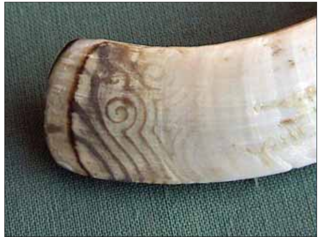
Slika 9. Obojenost kljova karakteristična za ulaganje tetraciklina u caklinu

Za uspješnu reparaciju zuba neophodno je ostvariti dva osnovna preduvjeta, postojanje dostatno jakih mehanizama prevladavanja narušenog zdravstvenog stanja te mehanizama za ponovnu izgradnju strukturalnih elemenata zuba. Meke česti zuba zaštićene su od brojnih vanjskih utjecaja ovojnicom građenom od tvrdih zubnih tkiva. Tako prvu liniju obrane zuba od vanjskih utjecaja čini zubna caklina. Caklina ujedno predstavlja i najtvrdje tkivo u organizmu s udjelom od oko 95 % minerala. To