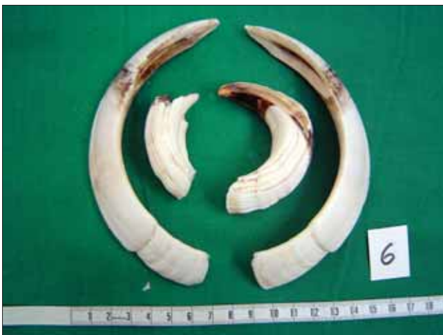
Slika 7. Prekid kontinuiteta rasta, obratite pozornost na izraženu liniju na površini kljove Figure 7 Disruption of the growth continuum, note the marked edge on the tusk surface

Posebnu zanimljivost predstavljaju naročiti oblici patologije, gdje se na kljovama, ponekad simetrično, a ponekad samo na jednoj, javljaju oštri prekidi u kontinuitetu te na takvim mjestima kljove izgledaju kao umetnute jedna u drugu (slika 7). Danas u literaturi postoji više opisa ovakvih kljova (Paláshthy i Paláshthy 1991; Kierdorf i Kierdorf 2003; Kierdorf i dr. 2004b; Konjević i dr. 2004a; Konjević i dr. 2006), a svi se autori manje – više slažu oko bakterijske infekcije kao uzroka ovog stanja te posljedičnog odvajanja distalnog, živog dijela kljove od proksimalnog, nekrotičnog dijela. U promatranim slučajevima prelomljenih kljova, kada je to bilo moguće bez primjene radikalnih