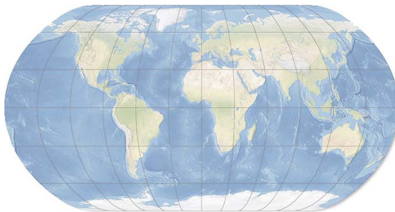
Fig. 2. Natural Earth projection designed with Flex Projector by Tom Patterson ( http://jenny.cartography.ch/projectiondesign.html )

Jenny, B.; Patterson, T.; Humi, L. (2008): Flex Projector - Interactive Software for Designing World Map Projections , Cartographic Perspectives 59, 12-27.