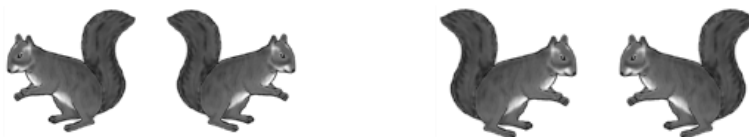
a) kategorijalna prostorna transformacija