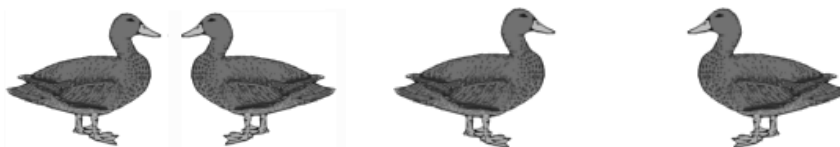
b) koordinatna prostorna transformacija

Računalo s 15" monitorom i instaliranim Super Lab Pro 1.05 programom za prezentaciju podražajnog materijala te bilježenje točnosti i brzine odgovora putem tipkovnice.