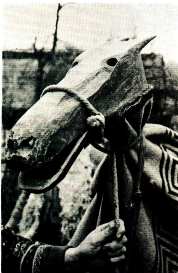
Sl. 9. Pokladna maškara: Drvena glava »kobile Linde«, Gornja Bistra. Snimila Z. Rajković, 1972. Fototeka INU, br. 6022.

kare maskirane kao cigani. Cigan je vodi, a dvije ciganke prose po selu i traže lanjski dug.