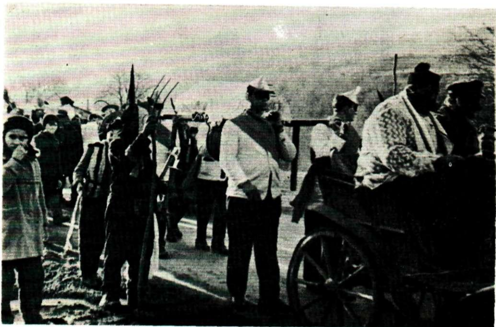
Sl. 6. Pokladna scena: sprovod, Oroslavlje. Snimljeno 1967. Fototeka INU, br. 6604.