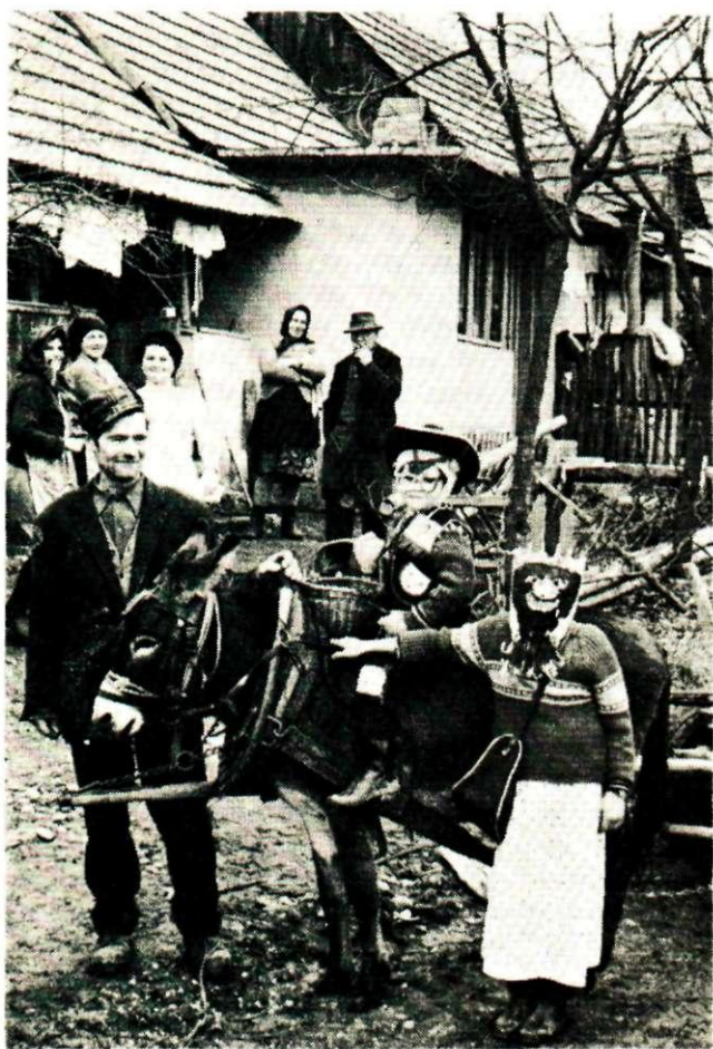
Sl. 2. Djeca maskirana na »fašnik«, Gornja Bistra. Snimila Z. Rajković, 1972. Fototeka INU, br. 6038.

Uza sav prodor žena među pokladne maškare, muškarci još uvijek imaju prednost u maskiranju. Oni nose ne samo većinu antropomorfnih maski nego su ostali jedini sudionici zoomorfnih maškara (kobila, konj, krava, medvjed, koza) i predmetnih maškara (mlin, brus). Primjer maskiranja žena je »Lucija« u Krušljevu Selu; u svadbenoj igri »mrtvec« žene iz svatova nariču i predstavljaju mrtvačevu ženu i rodbinu. Kuharica na svadbi sama glumi sirotu koja se opekla pri kuhanju te skuplja pomoć da bi išla liječniku.