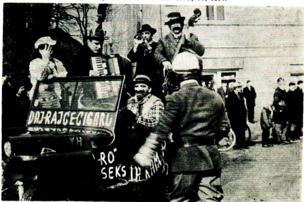
Sl. 7. Pokladna scena: muzikaši s autom, Oroslavlje. Snimljeno 1968.