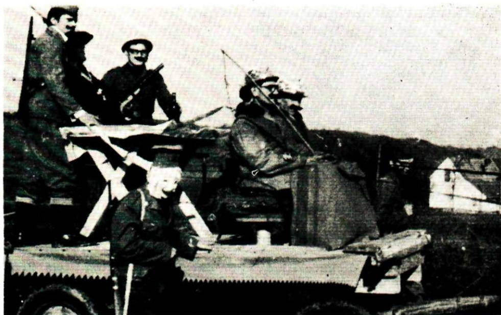
Sl. 3. Pokladna scena: žandari vode fašnika (lutku) na suđenje, Jakovlje. Snimio Z. Galjer, 1968. Fototeka INU, br. 4949.