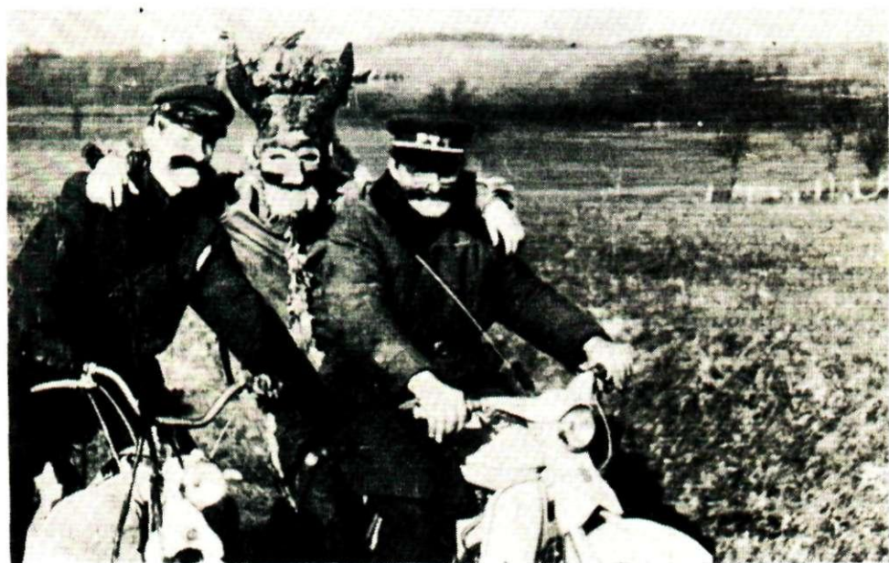
Sl. 8. Pokladna scena: »Lafra« i motorizirane maškare, Jakovlje. Snimio Z. Galjer, 1968. Fototeka INU, br. 4948.

U Oroslavlju je tradicionalno mjesto izvršavanja osude pred vatrogasnim domom. Tamo su podizali »galge« na koje su vješali fašnika. Osuda je uvijek imala šaljivi karakter, a uz smijeh redovito je bilo i bockavog kritiziranja. O osudi jedan kazivač kaže: »Onda smo mi već nekoga imali da ga malo zanitamo, zaribamo. Na primjer, ove godine 1972. smo to baš izveli na teret poljoprivredne zadruge. Njoj smo se rugali (bila je u likvi-