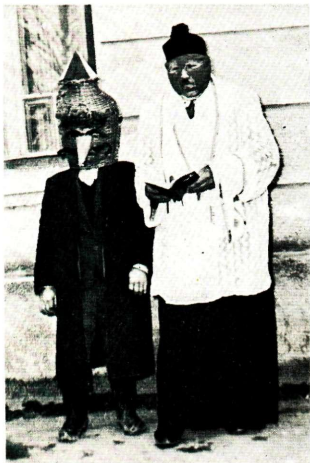
Sl. 5. Pokladne maškare, Oroslavlje. Snimljeno 1967. Fototeka INU, br. 6608.

selu. Prvi su braća Kovači, svirači, povelu fašnika na kolima iz Jakovlja u Donju Bistru. Bilo je to pred 60 godina, dok je u Donjoj Bistri bila općina i za Jakovlje. Poslije Kovača, nakon drugog rata (1952), opet su u povorci vodili fašnika iz Jakovlja u Donju Bistru. Tada im je bio vođa gostioničar Fingula, Franjo Solenički. On je ispred povorke jahao na konju »kao general«. Od tada se održava do danas ovaj pohod maškara iz Jakovlja u Donju Bistru.