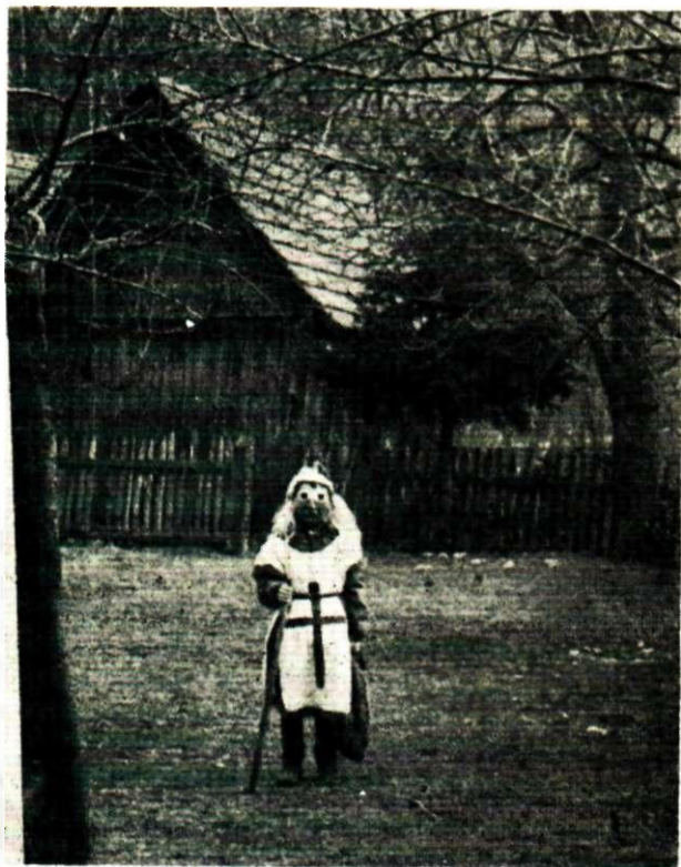
Sl. 1 Maškara s križem na košulji, Gornja Bistra.

prvi put zagorske maškare kratkom napomenom »kasno večerom dogju i maškare, te načnu plesati«. 3 Za svatskog starješinu kaže »on mora da je od boljih ljudi, pametan, razgovoran, mudar i da zna šalu počet, svega toga mora da je u njega puna glava i torba«. Opaska da starješina mora »da zna šalu počet« ukazuje na ovog svata kao na važnog glumca i vodi- telja dramski komponiranog svadbenog ceremonijala.