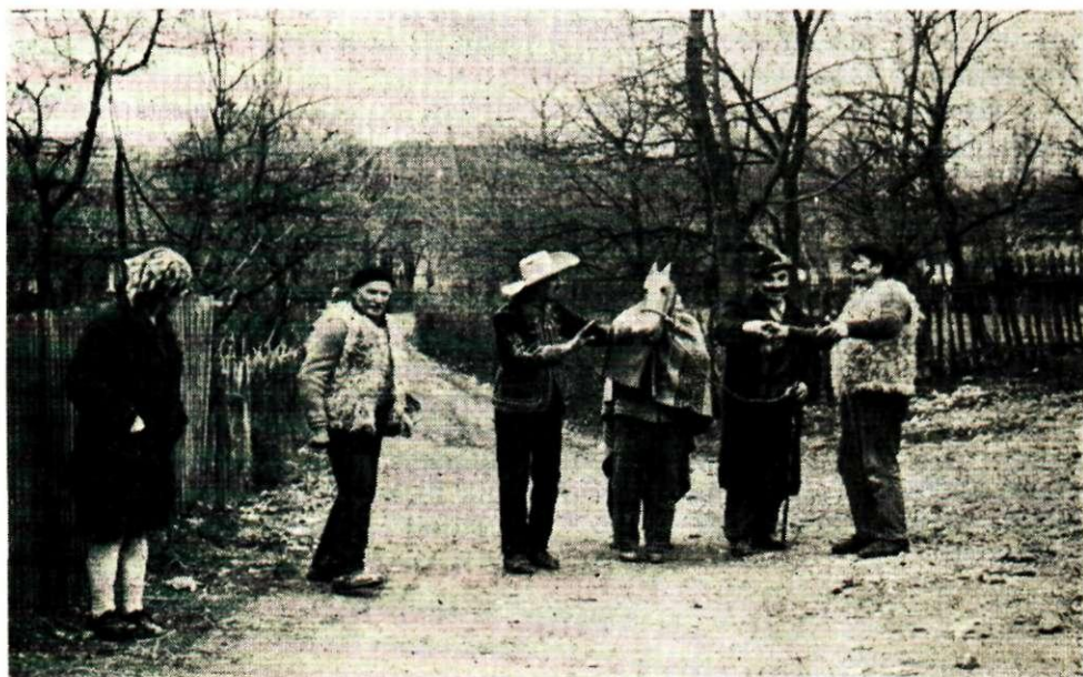
Sl. 11. Pokladna scena: maškare se rukuju nakon prodaje »kobile Linde«, Gornja Bistra Snimila Z. Rajković, 1972. Fototeka INU, br. 6028.

ricu u opisu kaže da se glava igrača nije vidjela, nego je iznad nje na dugačkom čupavom vratu bila konjska glava s velikim zubima. Ova je glava bila tako načinjena da je mogla odozdo lako otvarati i zatvarati usta. Karadžić napominje da narod u Dubrovniku pripovijeda da je životinja slična turici negda postojala, pa su je uhvatili i ubili. 33