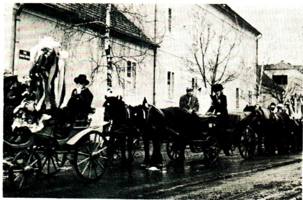
Sl. 4. Mladenci sa svatovima u pokladnoj povorci, Oroslavlje. Snimljeno 1967. Fototeka INU, br. 6607.