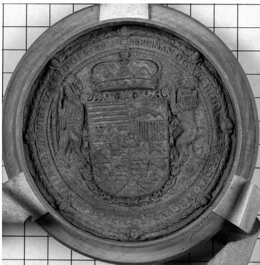
Slika 3. Pečat nadvojvode Ferdinanda, Arhiv Republike Slovenije, AS 1063, št. 1846

U zaključnom dijelu (32. i 33. redak) stoji da je Dekret tiskan u gradu Grazu dvanaestog dana mjeseca studenoga, godine 1599. Potpisani su nadvojvoda Ferdinand, dvorski kancelar W. Jöchlinger i notar H. Harrer, koji je napisao na latinskom da je isprava nastala po osobnom nalogu presvijetloga gospodina nadvojvode (34. i 35. redak isprave). Na dnu Dekreta nalazi se pečat nadvojvode Ferdinanda promjera 4 cm, koji je napravljen od crvenog voska. Riječ je o pečatu heraldičkog tipa na kojem piše: FERDINA DG ARCHI DVX AUSTRIAE DVX BURGUNDIAE STIRIAE KARINTHIAE CARNI WIRT COMS TIRO ET GORIT (slika 3.).