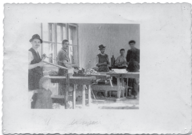
Slika 5: U radioni, snimljeno vjerojatno 1945. godine, autor nepoznat. EMZ, Stručna građa Dokumentacije pod brojem 311.

nastalih završetkom rata. Dana 12. 10. 1946. godine članovi Zadruga održali su i sjednicu na temu uvođenja električne energije i proširenja radionice, uz sudjelovanje Vojte Braniša, tadašnjeg ravnatelja Zemaljskog zavoda za kućnu radinost. Nakon toga, 4. 11. 1946. godine Zadruga je uputila dopis Ministarstvu socijalne politike, i to Odjelu socijalne zaštite i skrbi. U tom dopisu, uz općenite podatke o broju od 37 zadrugara koji prehranjuju 168 članova svojih obitelji, uz želju za proširenje radionice upućuju molbu za novčanu pomoć: ...obraćamo se naslovu s molbom, da nam iz svojih sredstava odobri i isplati novčanu pomoć za proširenje naše radionice i nabavu strojeva . Intenzivna suradnja sa Zemaljskim zavodom nastavlja se i u 1947. godini. Tako prema zapisu datiranom s 26. 2. 1947. godine profesor iz Zemaljskog zavoda na tri dana dolazi kao učitelj za preradbu i rad po novim šablonama . Rezultat ove suradnje je i dogovor od 29. 4. 1947. godine prema kojem zadrugari pristaju prihvaćati posao i isporučivati robu Zemaljskom zavodu.