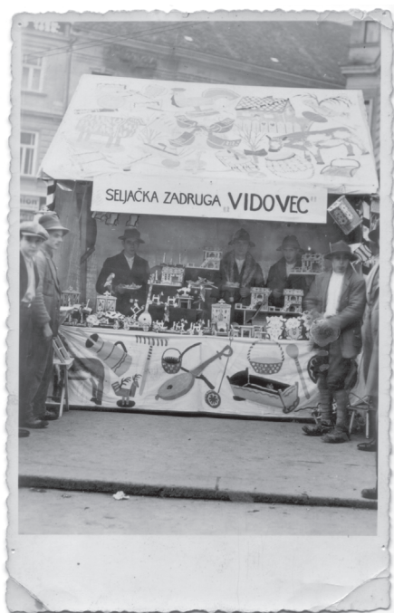
Slika 4: Izložba na Trgu Republike 1928. EMZ, Stručna građa Dokumentacije pod brojem 311.

motivima. (Jovičić-Svaglinac 1936:8) U tisku nalazimo informacije o tome da je u 12. mjesecu 1928. godine u Vidovcu održan i prvi ispit te da su sve izrađene igračke rasprodane na božićnoj izložbi u Zagrebu ( Drvorezbarska škola... 1929:462) (slika 3).