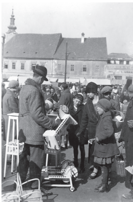
Slika 2: Svake srijede, na zagrebačkom trgu rasprodaje Vidovčanin svoj rad. Album Drvorezbarski tečaj zagrebačkog oblastnog odbora, ŠMZ Mf 1422/1-12.

Značajan impuls pokretanju obrtne proizvodnje u Vidovcu došao je od Ženske udruge za ušćuvanje i promicanje narodne pučke umjetnosti i obrta 3 . Zbog utjecaja koji je imao rad ove Udruge i njezine tajnice Ženke Frangeš na proizvodnju igračaka u Vidovcu, iznijet ću nekoliko podataka o samoj Udruzi. Udruga za ušćuvanje i promicanje narodne pučke umjetnosti i obrta osnovana je u Zagrebu 1913. godine sa željom da pomaže razvoju i napretku kućnog obrta. Djelovanje Udruge obuhvaća cijelu zagrebačku okolicu, a svrha joj je: