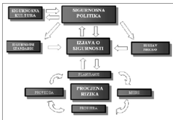
Slika 2. Sustav moguće implementacije NRKB/O u sigurnosni menadžment