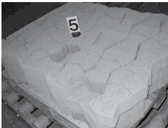
Slika 2. Betonski elementi na paleti

Radnik je stradao kad je htio ručno maknuti s transportne trake, na dijelu iza stroja za sačmarenje, dva elementa koja su ispala iz složaja prilikom podizanja, te ih postaviti u praznine u složaju na paleti udaljenoj cca 5 m na koju je automatski hvatač već prenio sve ostale elemente (slika 2).