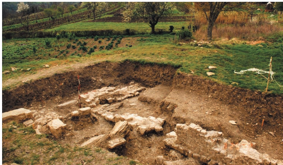
Sl. 1 Brkač, sv. Pankracije, sonda I, područje groblja

Djelatnici Arheološkog muzeja Istre iz Pule 1 u spomenutom su razdoblju otvorili više sonde, prosječne dubine 90 – 180 cm.