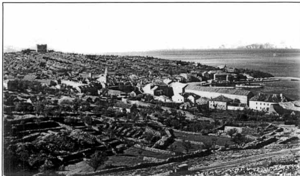
Sl. 4. Senj od sjevera, oko 1925./1930.