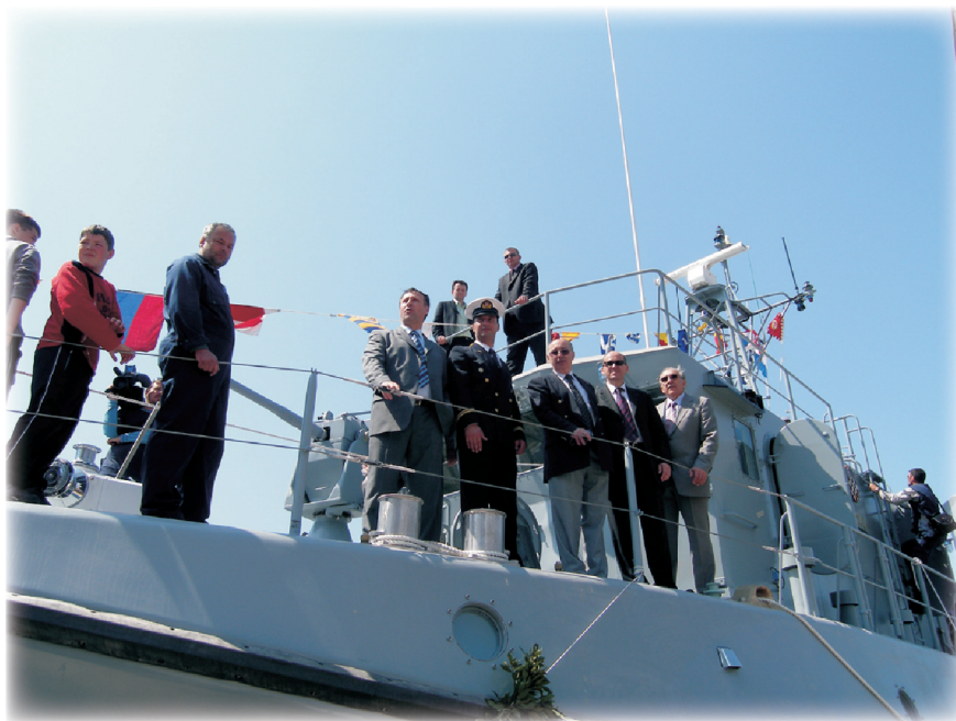
Visoki gosti predvođeni ministrom obrane RH Berislavom Rončevićem na palubi Korčule

Vela Luka i njezino brodogradilište Montmontaža-Greben upriličili su dana 22. travnja 2006. godine dugo i željno očekivanu svečanost porinuća malog protuminskog broda LM-51 krštenog imenom Korčula , čija je gradnja počela 1994. godine.