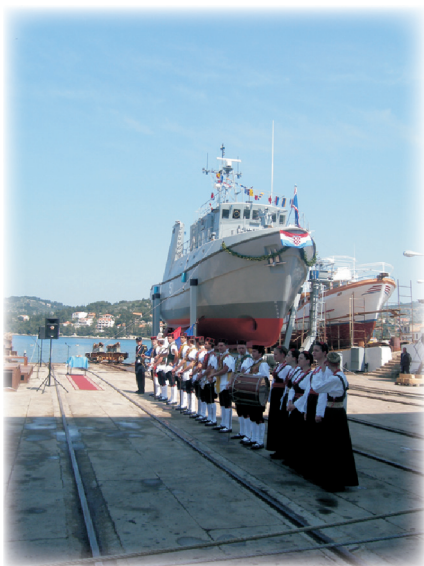
Svečano porinuće Korčule uveličala je velolučka Kumpanija