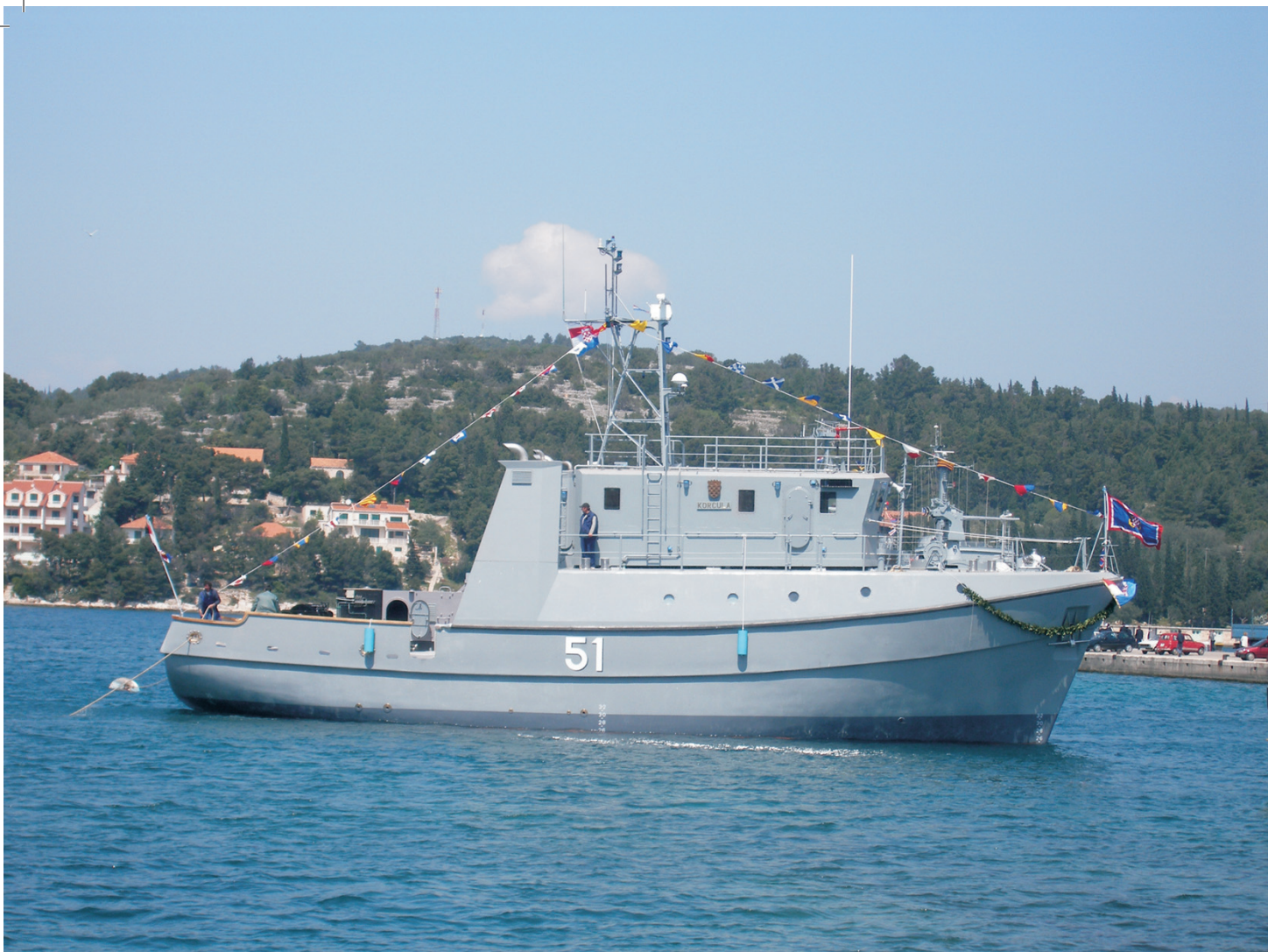
Mali protuminski brod Korčula uspješno zaplovio