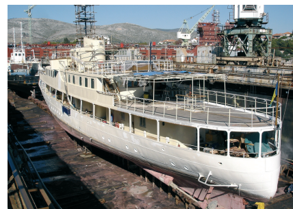
Vladimir Nazor prije preinake

suvremenom tehnologijom i u pravilu vrlo oštih linija, poput nebodera. Mali broj vlasnika voli romantičnu formu brodova njegovanu sredinom prošloga stoljeća, s opremom i šarmom pravoga broda. Među ove posljednje mogu se uvrstiti Henry