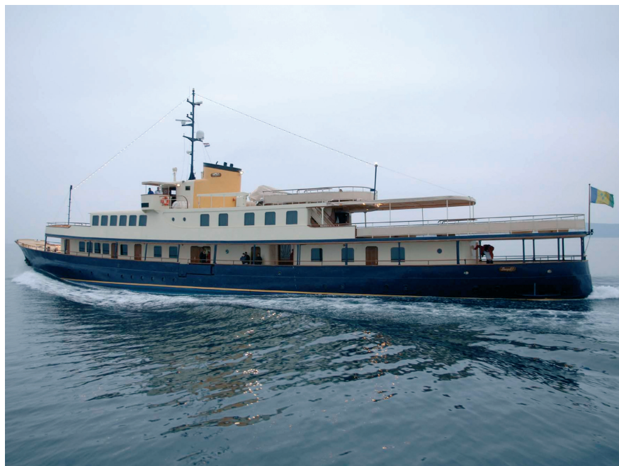
Seagull I - plovidba

54 godine star putnički brod Vladimir Nazor nakon dvogodišnje rekonstrukcije u Brodogradilištu Trogir postao Seagull I . Čak devet stranica pohvale u Boat Internationalu - najpoznatijemu mjesečniku za megajahte.