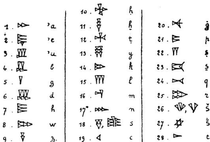
Sl. 2. Alfabet klinovog pisma u Ras eš - Šamra (po Dussaud-u).

tet, jod, kaf, lamed, mem, nun, pe, qof, reš, tau. Za alef postoje 3 znaka, u vezi s raznim izgovorom vokala. Pored toga postoje još dva oštija protosemitska h, analogno kao u arapskom; nadalje dvije vrste glasa 'aj n, opet slično kao u arapskom 'aj n, i ghaj n; dva znaka za samech, dvije vrste glasa ssade opet analogno s arapskim i napokon tri znaka za šin, što donekle odgovara dvijema arapskim znakovima: sin i šin, a treći možda odgovara drugom arapskom ta (sa tri točke) po izgovoru otprilike ths. Osobito je karakteristično da su brojno zastupani sibilanti: zain, 2 samech, 2 ssade, 3 sin, a i guturali su dosta brojni, tako da ovi glasovi daju osebujuću jaku karakteristiku ovom semitskom jeziku, što u tom pogledu nadmašuje i hebrejski i aramejski jezik. Čitav alfabetički sustav semitskoga klinovog pisma u Ras eš - Šamra sadržava ove znakove (Sl. 2): 20