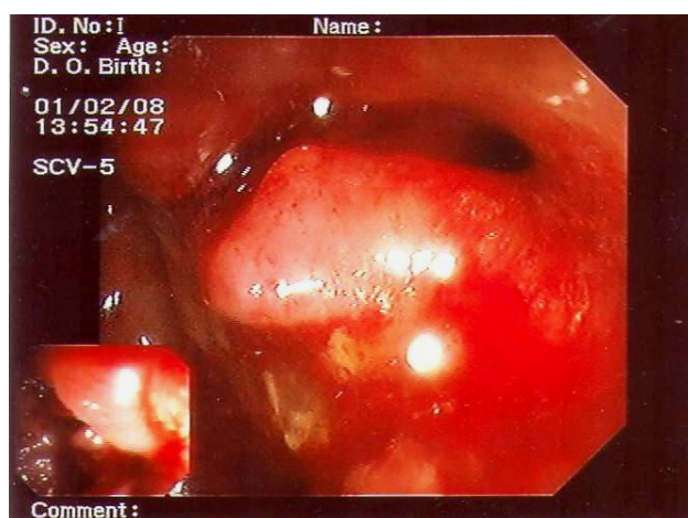
Slika 2. Kolonoskopija – tumor sigme Figure 2. Colonoscopy – sigmal tumour

U masnom tkivu uz crijevo nađeno je dvadeset limfnih čvorova duljeg promjera od 3 do 11 mm. U jednom limfnom čvoru vidljivo je metastatsko adenokarcinomsko tkivo.