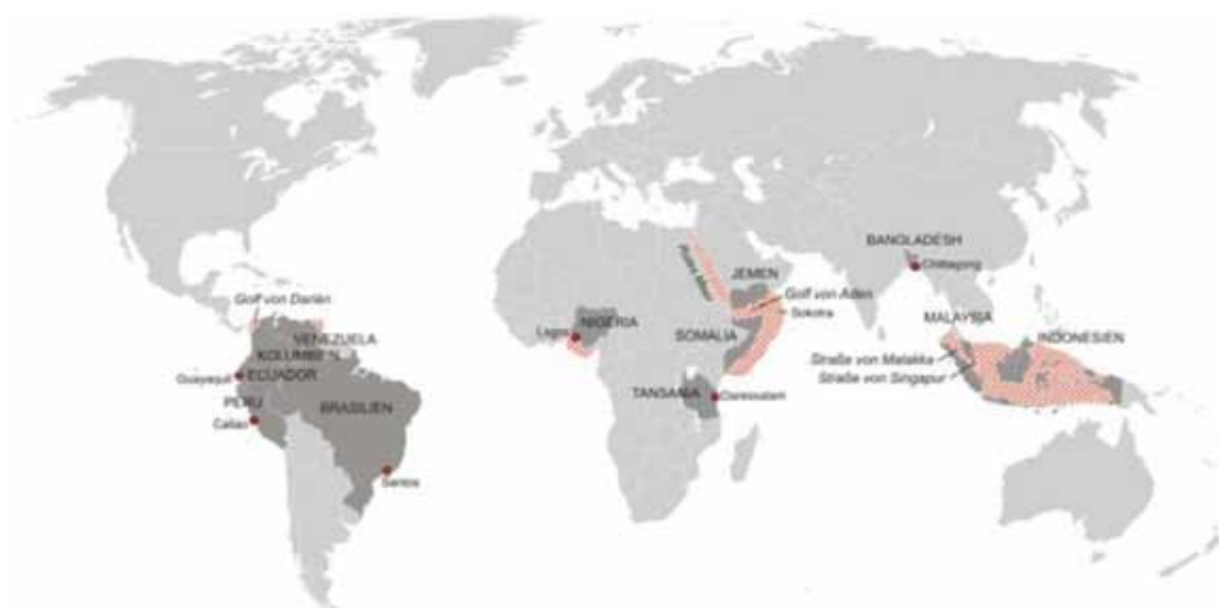
Slika 1. Krizna područja u svijetu Fig. 1. World's crises areas

Od 90-ih godina prošlog stoljeća aktivnost somalskih pirata varira ovisi o političkoj situaciji na kopnu, tako da je 2008. godine ona dosegla alarmantne razmjere, a početkom ove godine tijekom siječnja i veljače stagnira, i u ožujku i travnju raste za desetak puta više nego u isto vrijeme protekle godine. Ovdje je potrebno naglasiti da u Adenskom zaljevu uz piratstvo postoje i druge ilegalne aktivnosti, kao trgovina ljudstvom i krijumčarenje droge, alkohola, cigareta, sve do elektronike. Pritom je uz te zabranjene aktivnosti vrlo aktivno ribarstvo, pa je time otežano izolirati piratske od ostalih brojnih čamaca.