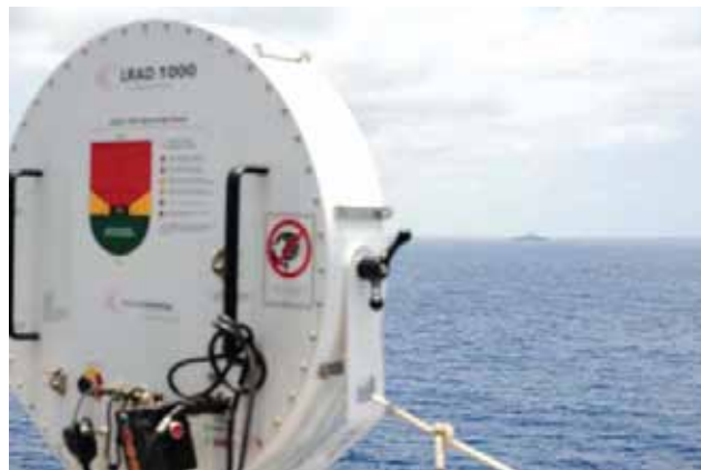
Slika 6. Uređaj dalekosežnog zvuka Fig. 6. Long Range Acoustic Device

Također, kompanije nabavljaju specijalne naprave LRAD ( long range acoustic device ) koje proizvode visokofrekventne zvukove što ih ljudsko uho ne može podnijeti. Zatim, posade rade raznovrsne prepreke da onemoguće pristup brodskoj palubi, kao bodljikavu žicu, priključuju visoki napon na brodsku ogradu, polijevaju uljem pristupe palubi, koriste se šmrkovima protupožarnog voda itd.