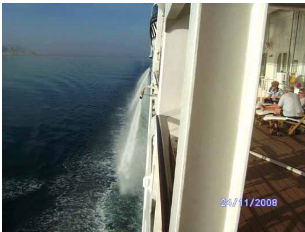
Slika 7. Šmrkovi za odbijanje pirata Fig. 7. Hoses for repulsing the pirates