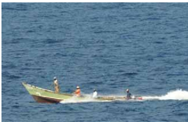
Slika 9. Jemenski ribarski čamac u Adenskom zaljevu Fig. 9. Yemen fishing boat in the Gulf of Aden

Budući da smo bili u kritičnoj zoni, toga sam jutra bio na zapovjedničkom mostu već prije sunčeva izlaska i tamo sam ostao cijeli dan. Tijekom jutra susreli smo velik broj jemenskih ribara - njihovi se čamci razlikuju od piratskih; obično su drveni s oštrim uzdignutim pramcem.