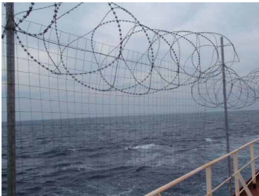
Slika 8. Bodljikava žica za obranu Fig. 8. Barked wire for defence