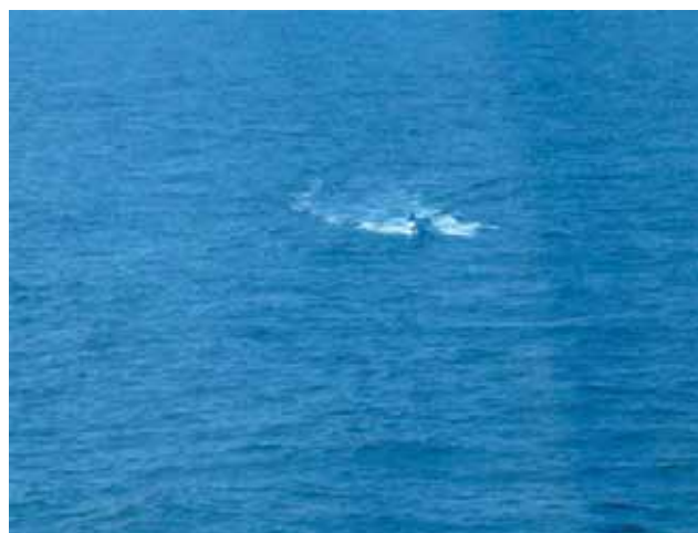
Slika 10. Napad na cruiser „Nautica“ Fig. 10. Attack on a cruiser „Nautica“

Na slici je prikazan piratski čamac koji ide prema brodu i posustaje; sliku je napravio jedan od putnika s balkona kabine.