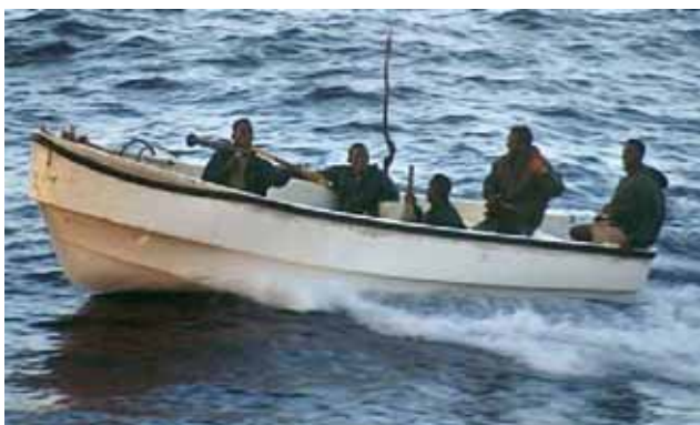
Slika 5. Somalijski pirati Fig. 5. Somali pirates

Pirati obično napadaju danju, i to u dva glisera - obično oko 6 m duljine, napravljena od plastike, sa zaobljenim pramcem i vanbrodskim motorima od svojim 80 KW koji razvijaju brzinu od oko 25 čv. U njima su četiri ili više pirata. Naoružani su puškama MK 47 i ručnim bacačima RPG te aluminijskim ljestvama s kukama na jednom kraju za kvačenje za brodsku palubu.