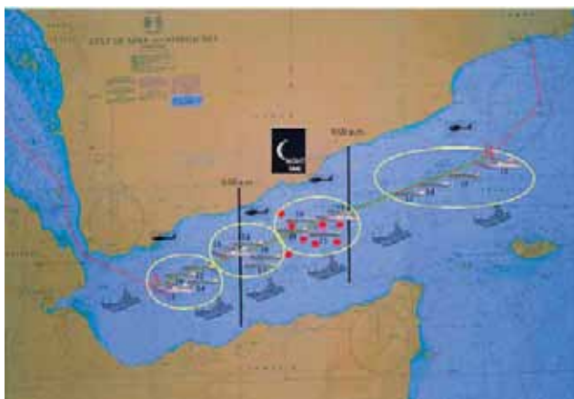
Slika 4. Grupni tranzit od Istoka prema Zapadu Fig. 4. Group transit from the east to the west

Jedno je ovdje važno napomenuti - pirati napadaju samo danju (protekle godine bio je samo jedan napad tijekom noći, i to kad je bio pun mjesec). Zbog te činjenice grupni se tranzit planira kroz najopasnije područje tijekom noći i međunarodne snage su pozicionirane u tom području, pa posebno u sumrak i zoru nadziru i čiste ulaz i izlaz iz zone mraka.