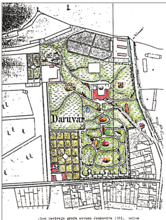
Slika 3. Dvorski perivoj u Daruvaru, preslika katastarske karte iz 1861. godine, kolorirana

Prvi izgled perivoja može se pouzdano utvrditi po katastarskim kartama iz 1861., jer se izgled perivoja do tada nije mijenjao. Perivoj je u vrijeme nastanka opisao i Taube, ali njegov opis treba uzeti s rezervom. Naime, on spominje i ribnjake, vodoskoke i kaskade na padinama brežuljka 55 , ali se čini da je to samo njegov pjesnički doživljaj, a ne i stvarni izgled parka. Naime, drugim povijesnim dokumentima to se ne može dokazati. Za rekonstrukciju prvobitnog izgleda perivoja poslužile su katastarske karte i Hühnovne litografije 56 , a za njegov kasniji izgled i rijetke fotografije.