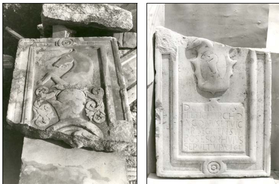
Sl. 2. Gornji i donji dio kamenog grba Dominika Miletića iz 1641. iz crkve sv. Franje u Senju (ulomci se danas nalaze u dvorištu Sakralne baštine u Senju).