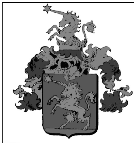
Sl. 1. Grb obitelji Miletić.