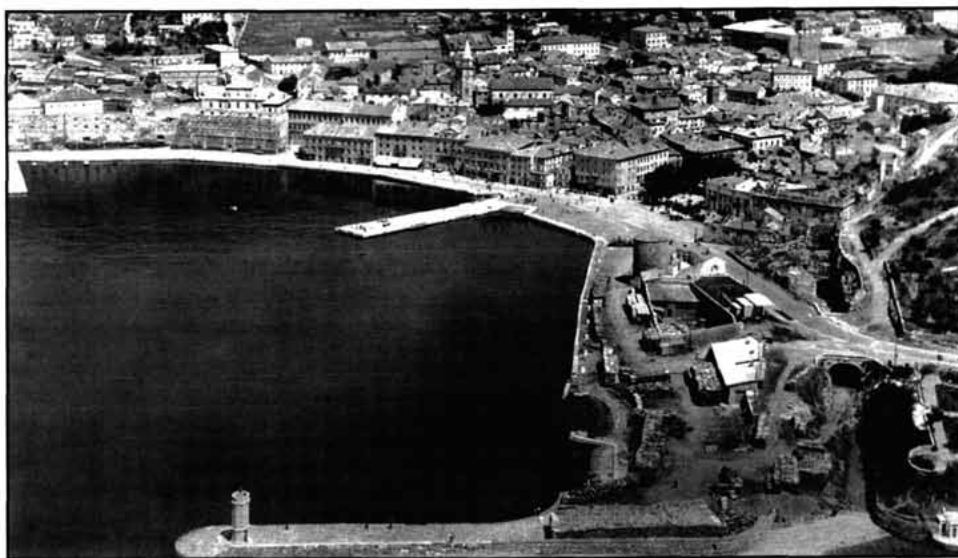
Sl. 2. Senj - grad i luka, snimak od jugozapada oko 1965.