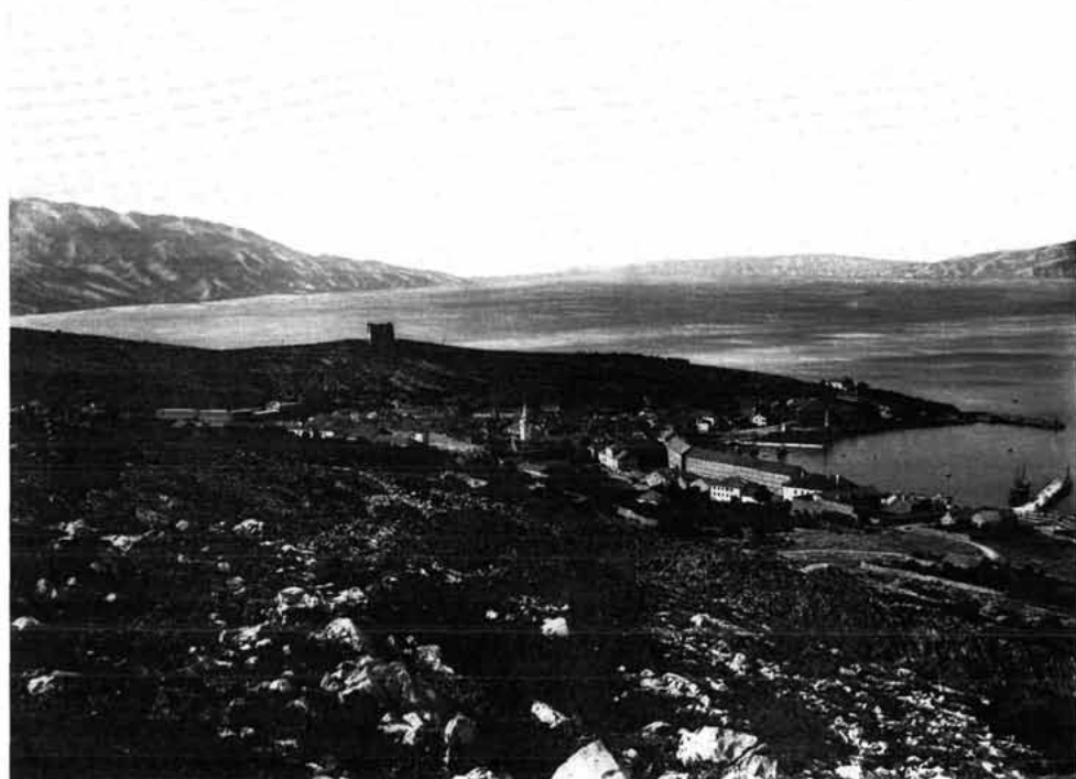
Sl. 2. Pogled na Senj oko godine 1905.

balkanskim obilježjima etike i ljudskosti. Nosilac i sljedbenik te ideologije je barbarogenije, koji nesentimentalnu divlju vitalnost svoje neiskvarene duše i otvorena divljeg srca unosi među ljude. To su Srbi i Rusi sa svojom sveljudskom ljubavlju. 11 A na posljednjoj stranici Mikčeve knjige "Efekt na defektu" uredništvo Zenita ističe da "zenitiste produžuju novoumetničku akciju međunarodnog pokreta koji je začet 1921. godine u našoj zemlji". Oni nastoje u "našu mlaku književnost" unijeti "novinu kao sveže i originalne elemente naše mlade, buntovne i neizražene rase". "Oni se bore za NOVU BALKANSKU KULTURU I CIVILIZACIJU (istaklo uredništvo), u kojoj odsada Srbi, odnosno Južni Sloveni pod njihovim kulturnim vođstvom ne smeju biti podređeni ni kulturno ovisni od Evrope, koja je u degeneraciji. Naprotiv: ZENITISTI BORE SE ZA BALKANIZACIJU EVROPE."