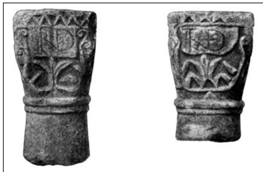
Otok Krk, kapiteli iz VI.-VII. stoljeća u franjevačkom samostanu na otočiću Košljunu

Na otoku Krku u morskoj uvali kod Punta nalazi se otočić Košljun. Tu je od XII. stoljeća benediktinska opatija, a od sredine XV. stoljeća naseljavaju se franjevci. U vrtu samostana nalazila su se dva kapitela