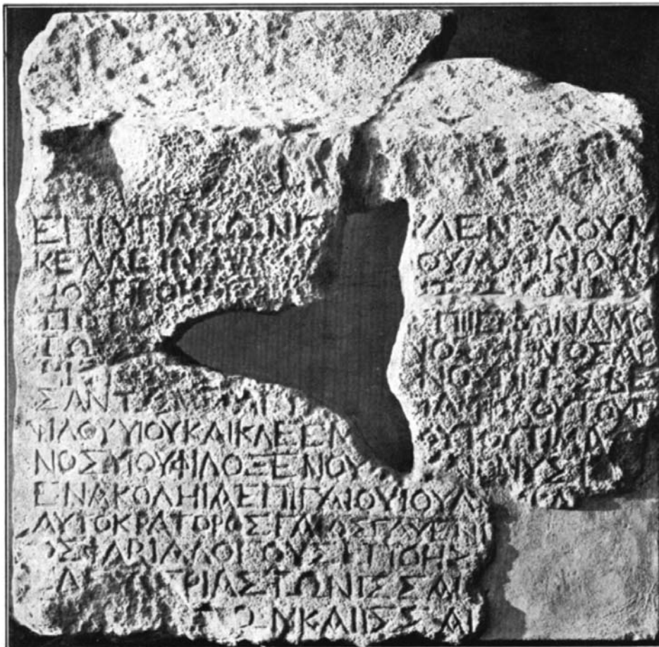
Salona, grčki natpis iz 56. godine pr. Kr. čiji su dijelovi nađeni 1904., 1906. i 1925. kod gradskih vrata Porta Caesarea

poslužitelj Arheološkog muzeja u jednom zidu blizu gradskih vrata. To je bio do tada najstariji natpis na tlu Solina.