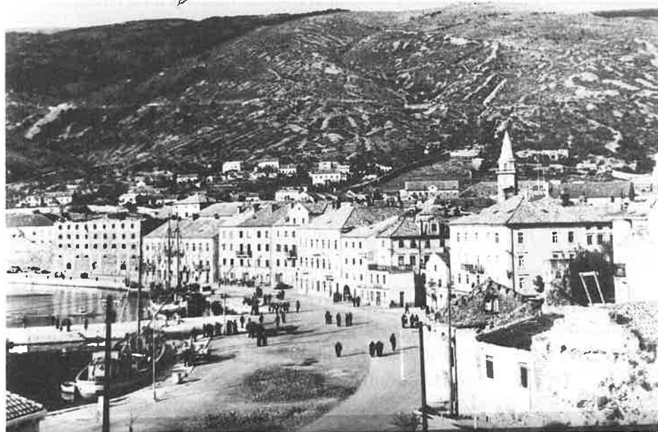
Sl. 2. Pogled na luku i grad Senj oko godine 1960.