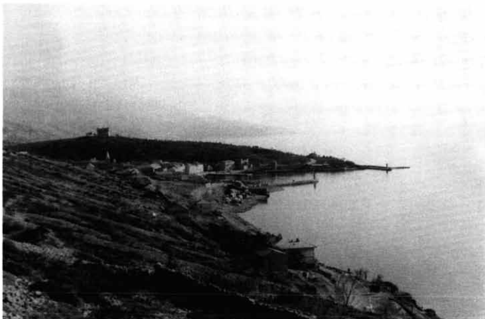
Sl. 3. Plava vila, Škver i grad Senj na snimku iz godine 1962.