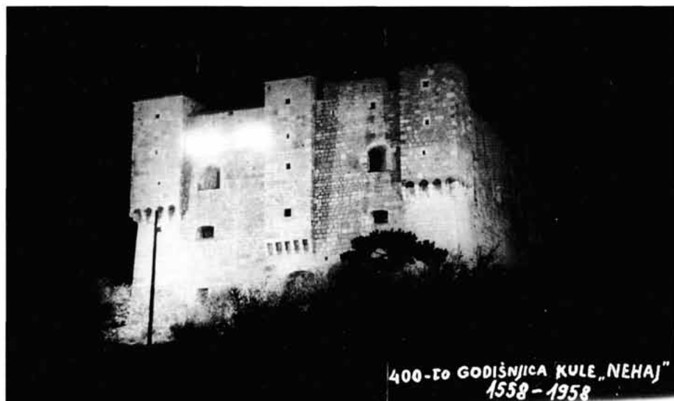
Sl. 3. Proslava 400. godišnjice izgradnje tvrđave Nehaj (1558. - 1958.).

haver notizia della persona che viena raccomandata". 48 O njegovu boravku u Senju nema uopće podataka.