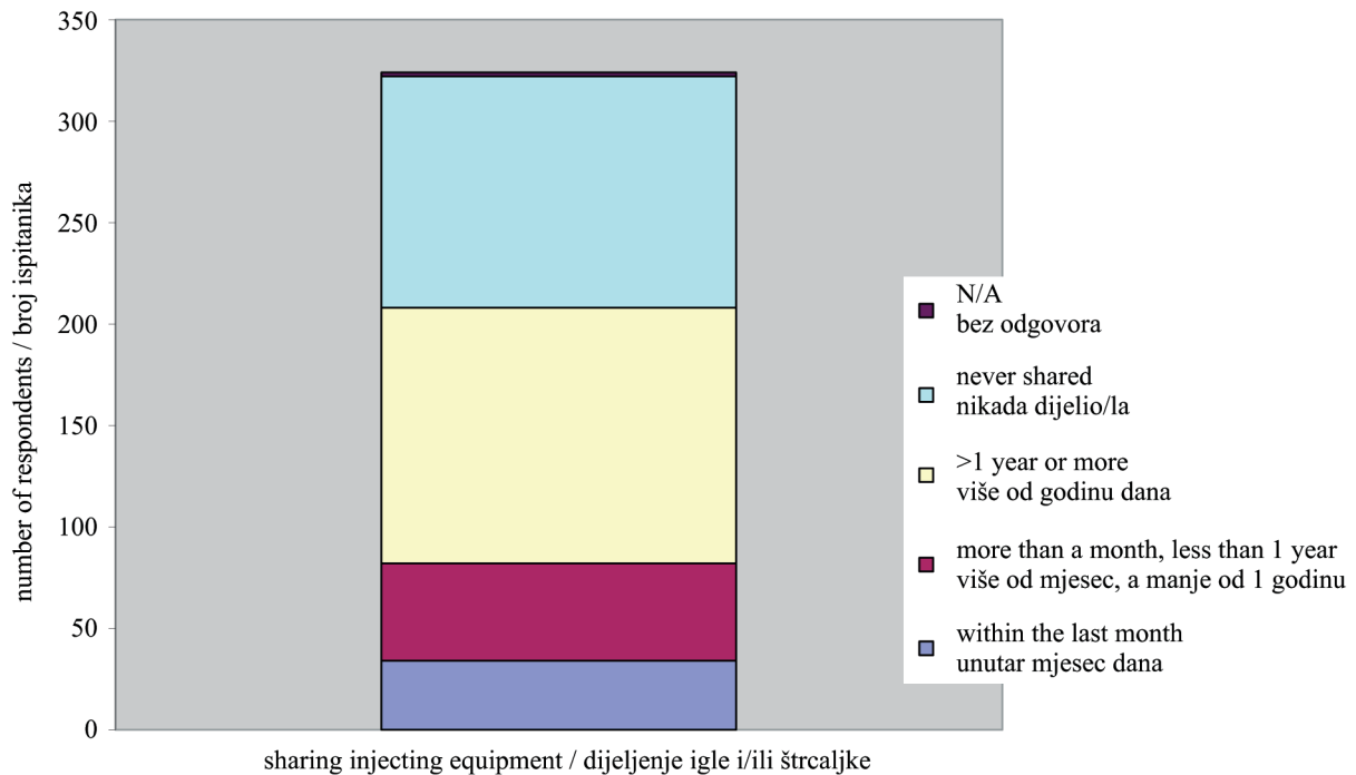
Slika 1. Dijeljenje igle i/ili štrcaljke pri injektiranju droge Figure 1. Drug injecting practices regarding sharing injecting equipment

za injektiranje droge unutar mjesec odnosno 75 % unutar godine dana navode da mogu nabaviti sterilni pribor za injektiranje droge.