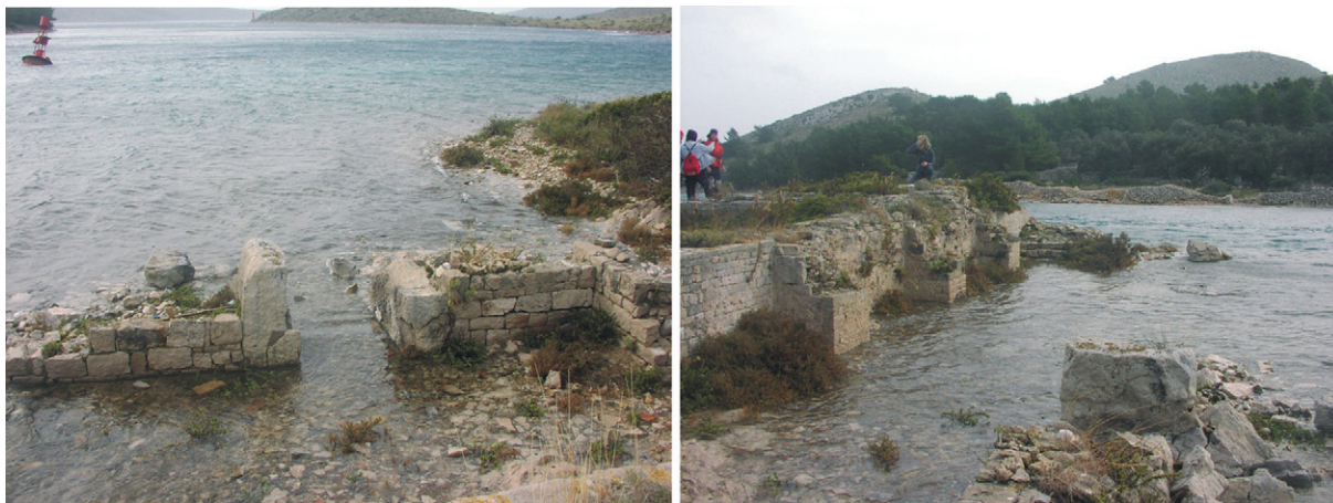
Slika 3. Djelomično potopljeni ostaci rimske vile rustike u tjesnacu Mala Proversa (Dugi otok) sagrađene u 1. st. (SURIĆ, 1952.). Ovaj objekt svakako upućuje na nekadašnju nižu morskú razinu, no ne smije poslužiti kao indikator relativne promjene morske razine s obzirom da su za to pouzdani samo objekti vezani izravno za razinu mora.

Figure 3 Partially submerged ruins of Roman villa rustica in Mala Proversa Strait (Dugi otok Island, Croatia), built in AD 1 st c. (SURIĆ, 1952). Such objects are surely the evidence of the former lower relative sea level, but must not be used as indicator of the relative sea-level changes since only the facilities connected directly to the sea-level can be regarded as reliable ones.