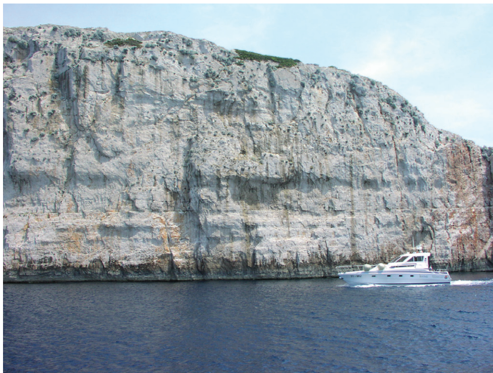
Slika 6. Selektivna erozija na Borovniku (Kornatski arhipelag) koja nalikuje izdignutoj plimskoj potkapini Figure 6 Differential weathering on Borovnik Islet within Kornati Archipelago resembling uplifted tidal notch

odnosno destruktivski oblici ne mogu biti datirani (teško je odrediti starost nečemu što nestaje ili je nestalo). Slična je situacija i sa spiljama – samo se sedimentima kao što su sige može odrediti starost. Što se tiče plimskih potkapina, iznimno bi zanimljiv bio nalaz potkapine koja bi ukazivala na maksimalnu razinu mora iz posljednjeg interglacijala (prije 125 ka) ili naknadno izdizanje ili tonjenje. Oblici slični takvoj potkapini mogu se naći na nekoliko otoka u Kornatskom arhipelagu (Sl. 6.), no njihov je nastanak zapravo vezan za selektivnu eroziju manje otpornih slojeva. Na takvoj potkapini najbitniji bi dokaz bili ostaci intertajdalnih organizama, posebno prstaca ( Lithophaga lithophaga ), no do sada su pronađena jedino mjesta ubušavanja koja se pripisuju prstacima (MARJANAC, MARJANAC, 2000.).