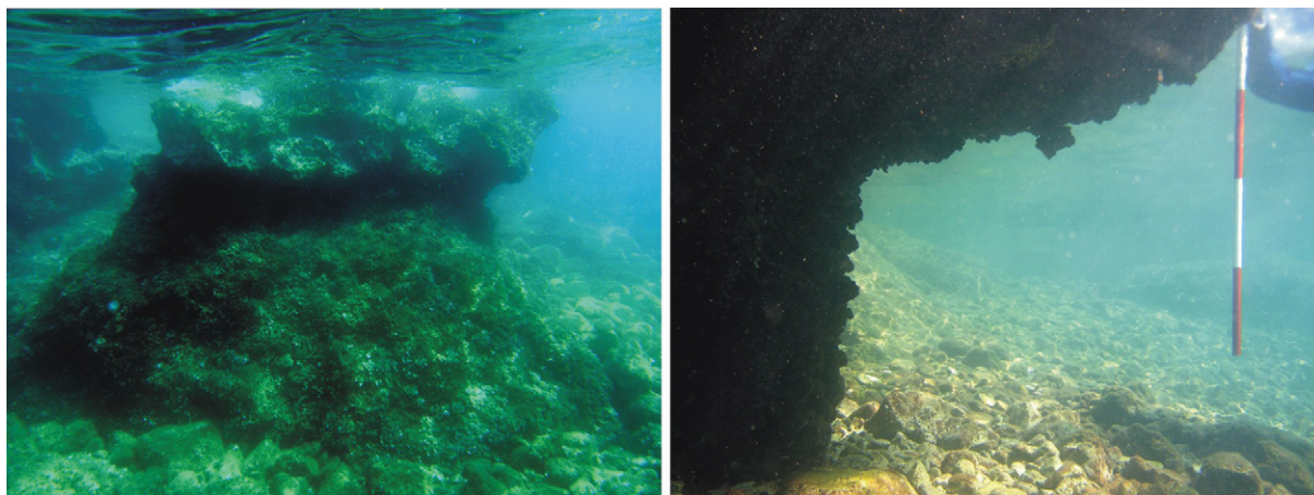
Slika 1. Potopljena plimska potkapina na otoku Krku Figure 1 Submerged tidal notches on Krk Island

valova, no na hrvatskoj se obali nisu proučavali s ciljem rekonstrukcije promjena morske razine. Za abrazijsku terasu smještenu na dubini 50-60 m ispred riječke luke smatra se da je nastala tijekom posljednjeg interglacijala (Riss – Würm) kad je razina mora bila nekoliko metara viša od današnje. Njezin današnji položaj interpretiran je kao posljedica spuštanja kopna brzinom od 0,6 mm/god (BENAC, ŠEGOTA, 1990.).