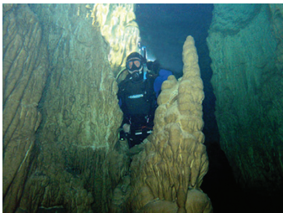
Slika 2. Potopljena siga na dubini od 56 m na otoku Braču (M. Garašić) Figure 2 Submerged speleothems at 56 m b.m.s.l. on Brač Island (photo by M. Garašić)

ŠEGOTA, 1990.), Neretve po dnu Neretvanskog i Korčulanskog kanala (ALFIREVIĆ, 1965.), Cetine duž Bračkog kanala (BAUČIĆ, 1967.) te Zrmanje, čije se paleokorito proteže Novigradskom morem, Masleničkim ždrilom, Velebitskim kanalom (FRITZ, 1972.), te vjerojatno dalje između Paga i Raba, južno od Cresa, Lošinja i Premude do sutoka s paleorijekom Po (BELIJ, 1985.). Ovdje je situacija slična kao i kod spilja – naime, erozijski oblici kao što su korita rijeka ne mogu se datirati, no, akumulacijske forme poput sedre, mogu. Iako je datiranje teretričkih nalaza sedre u Hrvatskoj učestalo (npr. HORVATINČIĆ I DR., 2003.), nalazi iz podmorja do sada još nisu bili analizirani. Na temelju položaja sedrenih barijera u morem potopljenom koritu Krke procijenjeno je da je razina mora prije 6900 godina bila 14 m niža od današnje (ŠEGOTA, 1968.). Nalaz sedre na otoku Lavsi u Kornatskom otočju naveden je na Osnovnoj geološkoj karti i procjenjuje se da bi mogao datirati iz donjeg kvartara (MAMUŽIĆ, NEDELA – DEVIDÉ, 1963.), no taj bi podatak trebalo temeljito preispitati jer bi postojanje sedre na tako malom i udaljenom otoku zahtijevalo ne samo značajnu promjenu morske razine, već i bitne tektonske pomake.