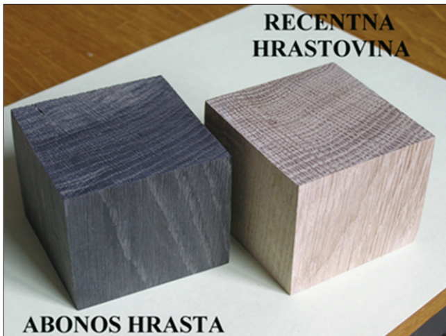
Slika 3. Prikaz poprečnog, radijalnog i tangencijalnog presjeka abonosa i recentne hrastovine

Figure 3 Displaying cross, radial and tangential sections of ebony and recent oak