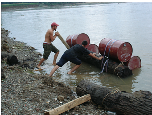
Slika 1. Privlačenje dijela debla abonosa na obalu Figure 1 Attraction of ebony trunk on the shore

Materijal za istraživanje tehničkih svojstava abonosa dobiven je dobrohotnošću gospode Benković Hrvoja i Franjić Darka, s područja Oštre Luke (Orašje, Bosna i Hercegovina). Abonos je na toj lokaciji slučajno pronađen tijekom eksploatacije šljunka. Nakon pronalaska dijelova stabala i debala abonosa na oko 6 metara dubine, proces njihovog vađenja i transportiranja bio je itekako zahtjevan. U vađenje dijelova stabala i debala s te dubine bili su uključeni ronionci, a transportiranje do obale obavljano je privezivanjem bačva za dijelove stabala i debala kao što se vidi na slici 1.