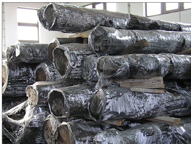
Slika 2. Trupci abonosa hrasta obavijeni plastičnom folijom Figure 2 Abonos oak logs wrapped with plastic foil

Dijelovi stabala i debala abonosa transportirani su u natkriveno skladište i djelomično obavijeni plastičnom folijom, kako bi se usporio proces sušenja (Slika 2.) Obavijanje folijom nužno je provesti da ne dođe do ras-