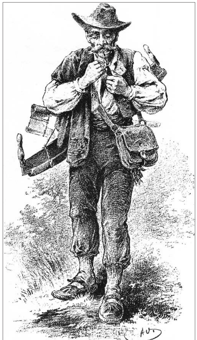
Slika 3. Goranski šumski radnik, dokument jednog vremena Figure 3 A forest worker from Gorski Kotar, a document of a period

putopisca Dragutina Hirc (1853–1921) – Hrvatsko primorje (1891), Gorski kotar (1898) i Lika i Plitvička jezera (1900). Izražavajući “bratsku hvalu” prijatelju