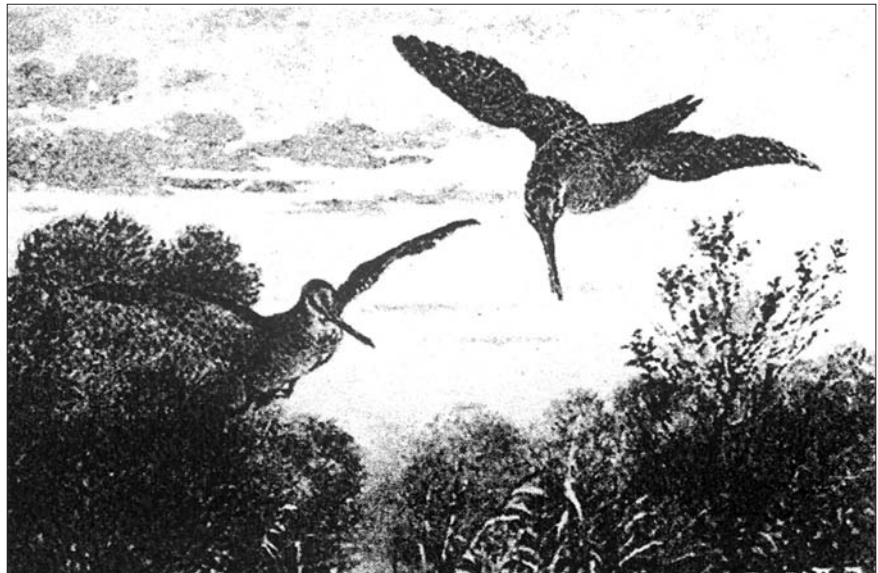
Slika 6. Šljuke u letu ponad Lonjskog polja, na razglednici Figure 6 Postcard picture of snipes flying over Lonjsko Polje

“Na velikoj čistini priređen je ogroman tabor. Od najraznolikijih saonica, od najprimitivnijih seljačkih napunjenih slamom pa do velikaških punih vučjih i medvjedih krzana, napravljen je veliki krug, a unutar njega plamsa preko 20 ognjeva, a nad svakim po neko božje stvorenje, bud tele, bud prase, tukac ili orožak nataknut na ražanj kojeg jedva seljak lagano okreće, dok drugi nad njim stoji i pržeći slaninu maže pečenicu. Raznose se velike porcije dok su još vruće među ljudstvo koje ih požudno rukama hvata i guta. Kupovi kruha i drugog peciva, slanine, sira i luka leže na prostrtoj slami i na pokrovcima. Veliko bure vina i nekoliko barilaca rakije obsjedaju vazda žedni goniči, tražeći vino i rakiju kao za okladu.”