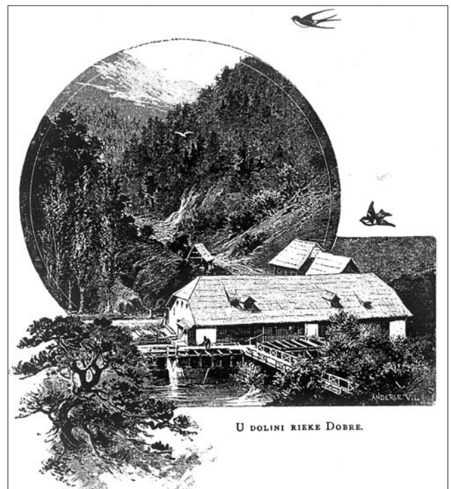
Slika 5. Pilana potočara na Dobri; iz dojmljivog opusa šumara i likovnjaka V. L. Anderlea

“Postavili su nas na niski nasip. Stajao sam četvrti na desnoj strani čela pogona, u zaklonu jedne stare dvokrake topole... Svuda je vladala tišina... Ali ipak nešto. Motreći pred sobom okoliš, učini mi se da se je