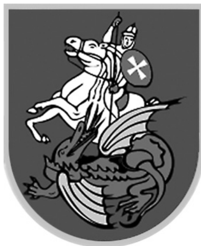
Slika 3: Grb grada Paga / Figure 3: Coat of Arms of the Town of Pag