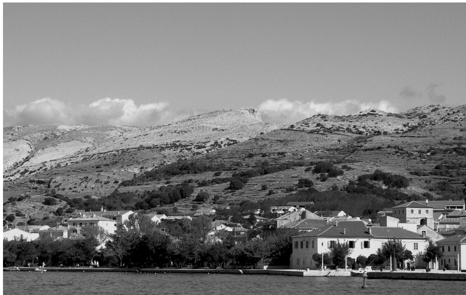
Slika 2: Sveti Juraj. Snimio: G. P. Šantek, 2006. / Figure 2: St. George, photo by G. P. Šantek, 2006