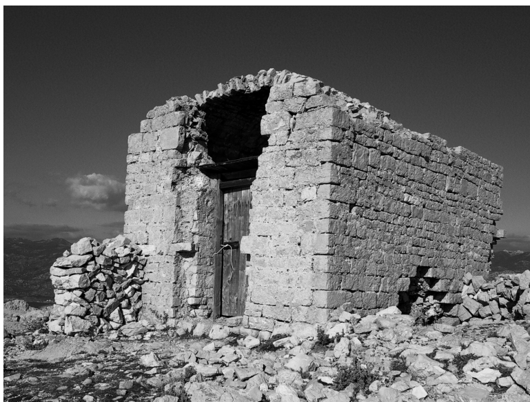
Slika 6: Sv. Vid. Snimio: G. P. Šantek, 2006. / Figure 6: St. Vid, photo by G. P. Šantek, 2006

Treća je točka ovoga svetog prostora crkva svetoga Vida na istoimenom vrhu, a o njezinoj nekadašnjoj važnosti i ljepoti dostatno govori to da je cijenjeni zadarski povjesničar umjetnosti Emil Hilje smatra ponajljepšim spomenikom srednjovjekovne arhitekture na Pagu (Hilje 1999:23). Prema povijesnim podacima (ibid.) smatra se da je crkva izgrađena početkom 14. stoljeća. Emil Hilje (1999:25) kao njezinu posebnu odliku ističe pravilnost s dimenzijama, bez apside, 4,15 \times 6,60 m. Crkva je danas u prilično lošem stanju i potrebna joj je obnova, što je vidljivo i na fotografijama.