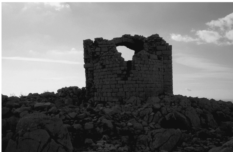
Slika 7: Sv. Vid. Snimio: G. P. Šantek, 2006. / Figure 7: St. Vid, photo by G. P. Šantek, 2006

Mjesto na kojemu danas stoji ova crkva svoju je sakralnu važnost imalo i u ranije pretkršćansko doba (usp. Katičić 2007, Belaj i Šantek 2006c, Pleterski 2009). I dok to sa sigurnošću možemo reći za razdoblje doseljavanja Slavena, jer mjesto čuva simboličke poruke o boju Gromovnika sa Zmijom i uklapa se u svetu tročlanu strukturu Praslavena, o njegovu sakralnom značenju u prijašnje pretkršćansko vrijeme Liburna možemo samo slutiti. Danas, koliko je autoru poznato, vrh Sveti Vid nije mjesto obavljanja ikakvih praksi pučke pobožnosti, no postoje opravdane pretpostavke da su na njemu nekada završavala hodočašća Pažana i davali se zavjeti. Iako imamo dobre razloge sumnjati u znatan dio podataka koje nam vezano uz Sveti Vid i tamošnje obrede daje paški arheolog Ante Šonje, vjerujem da, s obzirom na vrijeme i sredinu u kojima je njegov rad pisan, samo hodočašćenje na Sveti Vid nije izmišljeno (usp. Šonje 1995). U takvu, vjerojatno faktički netočnu ali predodžbeno i simbolički značajnu građu, idu i izjave nekih stanovnika Svetom Vidu najbližeg mjesta Kolana kako je na njemu sve do prije nekoliko stoljeća stajao poganski kumir. U pučkom sjećanju i usmenoknjiževnim tvorbama imamo, po svemu sudeći, i dan-danas tragova predodžbi o Svetom Vidu kao ne samo kršćanskom mjestu.