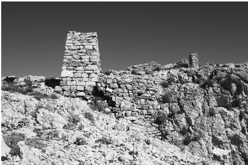
Slika 4: Sv. Juraj. Snimio: G. P. Šantek, 2006. / Figure 4: St. George, photo by G. P. Šantek, 2006