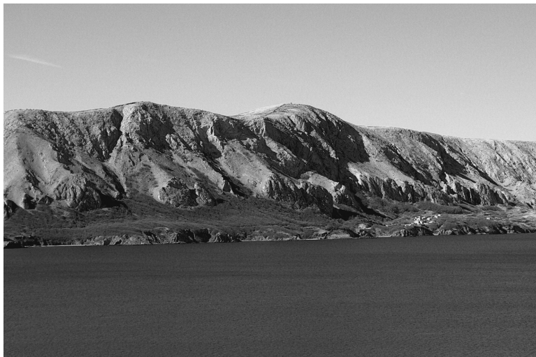
Slika 1: Sveti Vid. Snimio: G. P. Šantek, 2009. / Figure 1: St. Vid, photo by G. P. Šantek, 2009.

st. koju na njemu naziremo. Ispod strmo obrušavajuće padine nalazi se tamni plato kojemu boju daje, zbog važnosti i ljepote zaštićena, šuma Dubrava. A ispod nje je plavetnilo mora koje je zna se čiji svijet. Lako možemo, kao i stari Hrvati koji su po nastanjivanju proveli sakralizaciju ovoga prostora, zamisliti kako Perun stoluje gore, pri nebu, na gori, na krošnji svetoga duba u svetomu gaju: dubravi. Gora je za njih zapravo simbolički bila isto što i sveto drvo, a sve su njegove značajke mogli uočiti i ovdje na Pagu, čija gora s vrhom Svetim Vidom potpuno odgovara slici svetoga drveta iz praslavenske sakralne poezije.