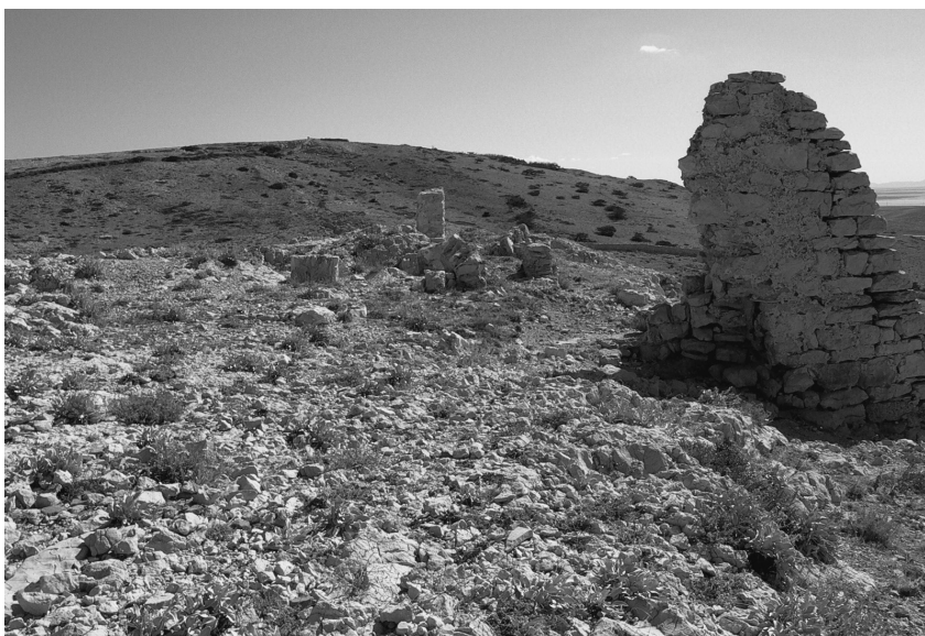
Slika 5: Sv. Juraj. Snimio: G. P. Šantek, 2006. / Figure 5: St. George, photo by G. P. Šantek, 2006