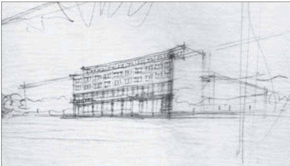
SL. 4. V. ANTOLIĆ: SKICA HOTELA I KINA „BANIJA” U KARLOVCU (NEIZVEDENO?), SREDINA 1930-IH FIG. 4 V. ANTOLIĆ: HOTEL AND CINEMA “BANIJA” IN KARLOVAC, SKETCH (UNEXECUTED?), THE MID-1930S

kinodvoranom, kino gospođe Višin (Metropol kino) na nepoznatoj adresi, detaljne studije nekoliko interijera kinodvorana i skice četverokatne interpolacije u nekoliko varijanti pročelja. Četverokatnica za interpolaciju (ili poluinterpolaciju u detaljnijoj razradi) gotovo je sigurno Antolićeva inačica „Doma inženjera” u Šubićevoj ulici u Zagrebu, koju radi početkom 1937. zajedno sa zgradama iste namjene na različitim lokacijama: u Pierottijevoj – u funkcionalnome nastavku tada planiranoga Tehničkog fakulteta te na krizanju Veberove i Vinkovićeve ulice, sto je trebala biti klupska kuća inženjera i arhitekata. 8