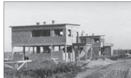
SL. 8. CVJETNO NASELJE U GRADNJI, U DRUGOM PLANU KUĆA ANTOLIĆ, U POZADINI STARI SAVSKI NASIP, 1938.

Po uredbi koja je od gradske uprave izdana za gradnju kuća u Cvjetnome naselju bio je zadan njihov vanjski izgled. Uz jednostrešni