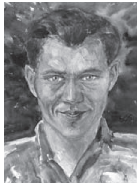
SL. 3. V. ANTOLIĆ: AUTOPORTRET, 1929. FIG. 3 V. ANTOLIĆ: SELF-PORTRAIT, 1929