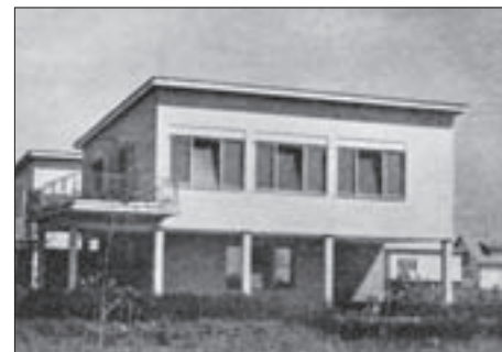
SL. 9. CVJETNO NASELJE – KUĆA TIPA A 110, OBJAVLJENO 1940.

FIG. 8 CVJETNO NASELJE IN CONSTRUCTION, ANTOLIĆ'S HOUSE IN THE BACKGROUND, OLD SAVA EMBANKMENT IN THE DISTANCE, 1938