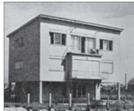
FIG. 10 CVJETNO NASELJE – HOUSE OF THE A 140 TYPE, PUBLISHED IN 1940