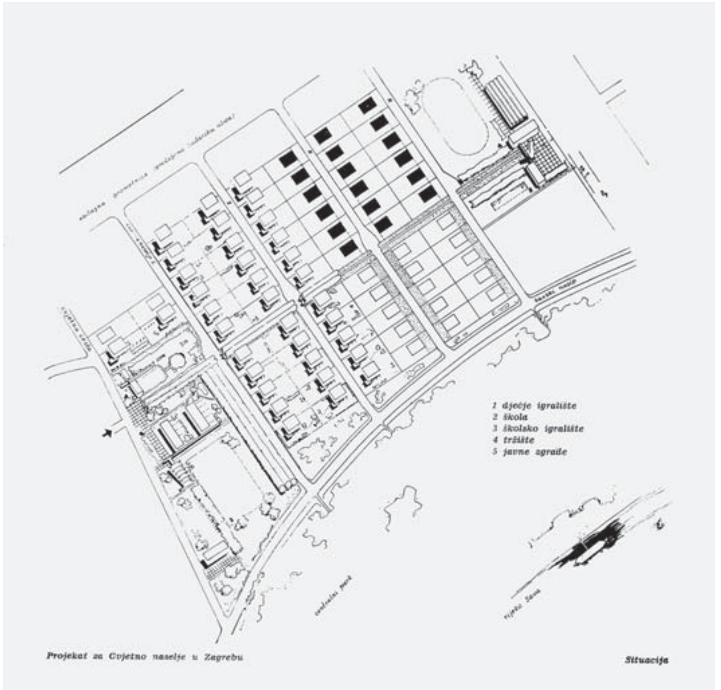
SL. 1. URBANISTIČKA SITUACIJA CVJETNOGA NASELJA, OBJAVLJENO 1940. FIG. 1 SITE PLAN OF CVJETNO NASELJE, PUBLISHED IN 1940