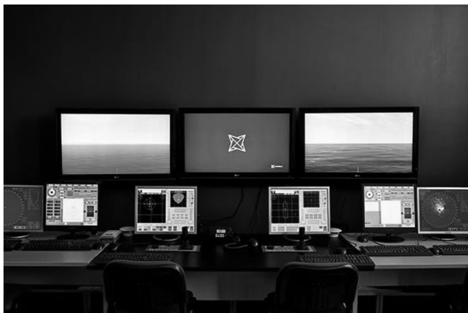
Slika 2. Oprema za DP tečajeve, Adriamare učilište u Splitu Figure 2. DP course equipment, training centre Adriamare in Split