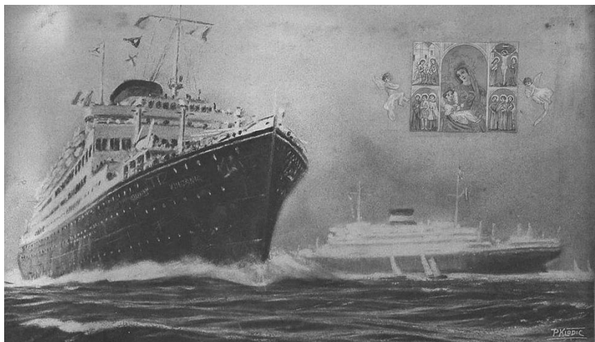
Slika 3. Zavjetni kolaž parobroda Vulcania Figure 3 Steamship Vulcania's votive collage

trenuci parobroda i dva preživjela brodolomca na prevrnutoj brodici za spašavanje kako se bore za život. U desnom donjem kutu naknadno je nalijepljen ovalni papirić s vijencem osušenih grančica i crnim križem u sredini, a zavjetni je zapis ispisan pisaćim strojem crvenom bojom na komadiću papira umetnutom pod staklo kojim je zaštićen zavjetni dar [10].