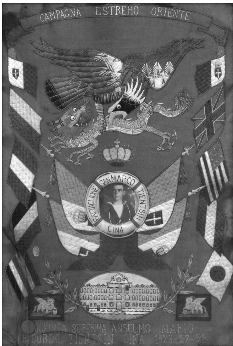
Slika 5. Svilena zastava s putovanja u Kinu 1926. – 1928. Figure 5 Silk flag from journey to China in 1926 – 1928