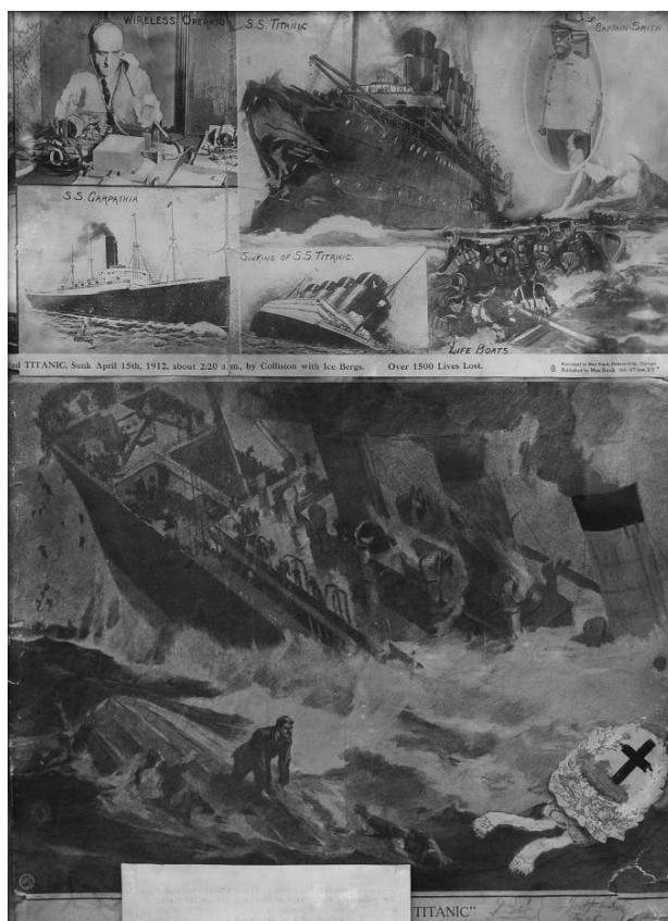
Slika 2. Zavjetni kolaž parobroda Titanic Figure 2 Steamship Titanic's votive collage

kaz je da su se nesreće ipak događale. S obzirom da su putnici, ali i bijelo osoblje parobroda, bili novi element u pomorstvu, ne čudi neuobičajeni likovni izraz njihovih ex vota i odvajanje od višestoljetne zavjetne tradicije s kojom nisu imali ni doticaja. Ipak, ovi se zavjeti javljaju samo iznimno, a zanimljivo je da su jedina dva u Trsatskom svetištu izrađena tehnikom kolaža, čemu bi glavni uzrok mogle biti skromnije financijske mogućnosti naručitelja.