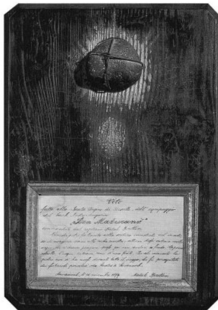
Slika 1. Zavjetna ploča s kamenom barka Ban Mažuranić Figure 1 Bark Ban Mazuranic votive tablet with the stone