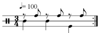
Dva, jedan (snimila i transkribirala M. Kovačič)

Kampanari govore da izvode šest različitih sonada , premda se prema glazbenoj strukturi razlikuju samo tri. Izvođenjem istoga komada ( sonade ) stvaraju drukčiju zvučnu sliku ako zamjenjuju uloge na zvonima, tako da svaki kampanar izvodi jednak ritamski obrazac, ali na drugom zvonu. Kampanari takav komad shvaćaju kao sasvim nov jer na pitanje zašto zamjenjuju uloge odgovaraju "sada će bit sasvim druga melodija" (Kukuljanovo 2006). Tako, na primjer, kod komada Dva, jedan , koji je predstavljen u prethodnom primjeru, zamjenjuju uloge svi kampanari :