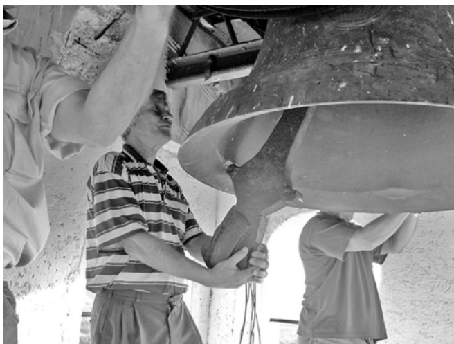
Kampananje u Donjem Jelenju 29. 9. 2006.

U skupini je pet kampanara , ali samo trojica od njih kampanaju istodobno i zamjenjuju se u kampananju . Kampanaju tako da svaki izravno rukom drži bat svojeg, samo jednog zvona i njime udara o unutrašnji rub nepomičnog zvona.