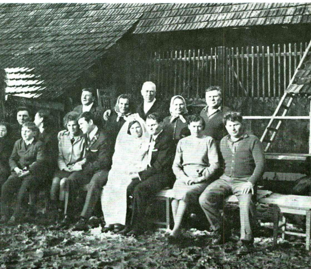
Fotografiranje najuže obitelji na kraju svatovskog veselja

Sve fotografije snimio je L. BARAN u Ivanovu Selu 1969. godine. Čuvaju se u fototeci Ustava pro etnografii a folkloristiku ČSAV u Pragu.