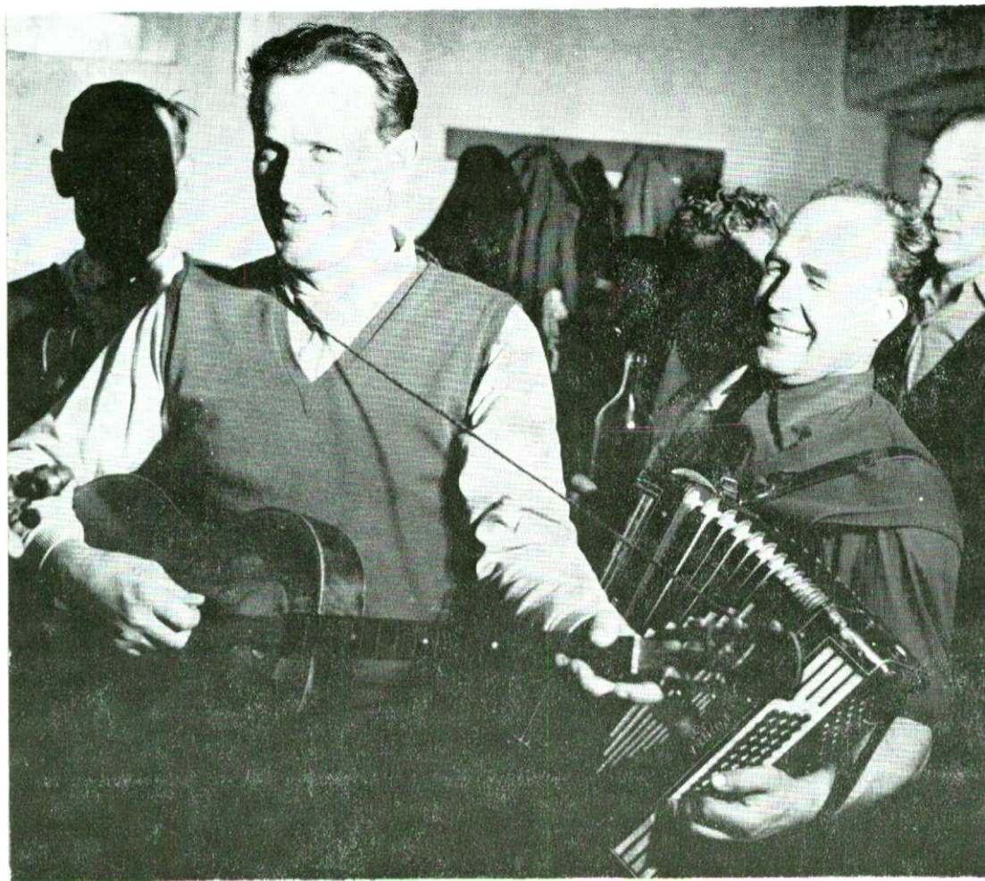
Glazbenici sviraju za ples, Ivanovo Selo