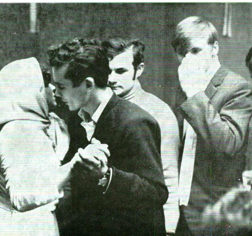
Djeverov ples s nevjestom, Ivanovo Selo