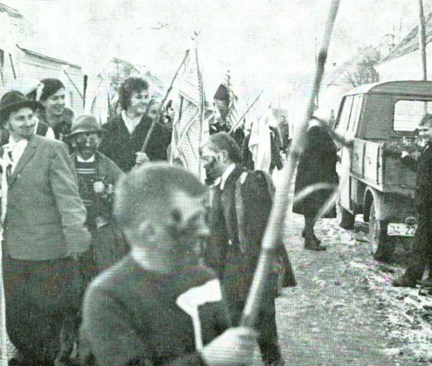
Povorka maškara kroz selo, Ivanovo Selo