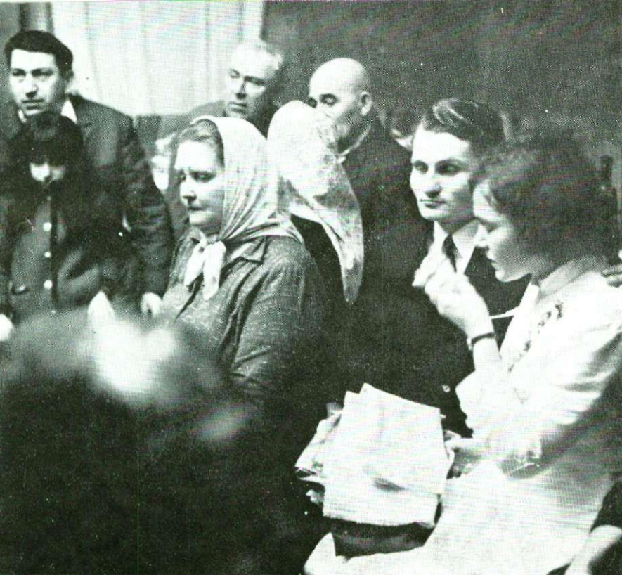
Skidanje vjenčiča i obiranje za nevjestu, Ivanovo Selo