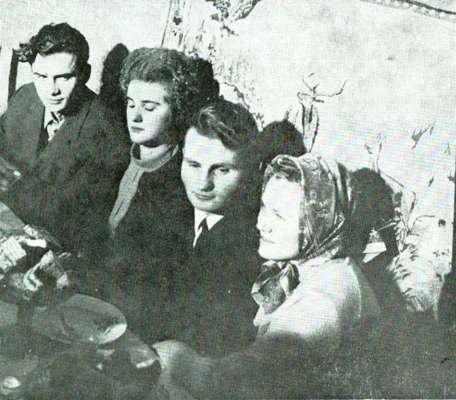
Nevjesta s mladoženjom te djeverušom i djeverom pri »ovčenečku«