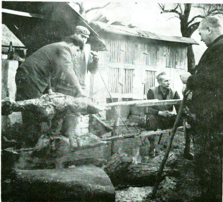
Pečenje ovna kod mladoženjinih roditelja, Ivanovo Selo