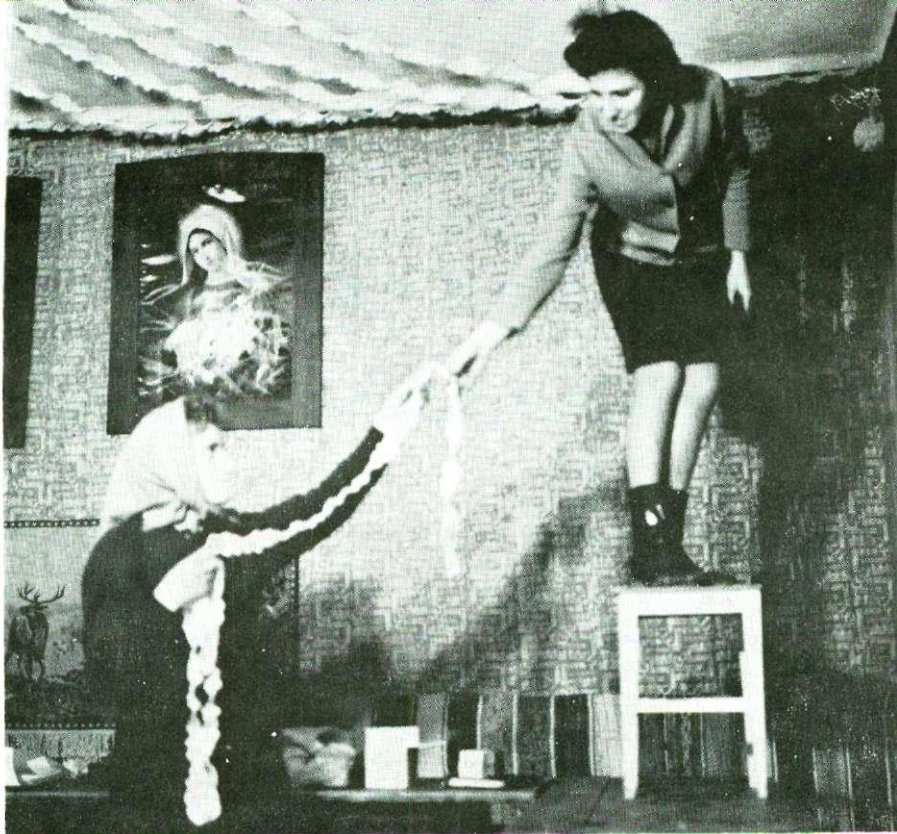
Ukrašavanje sobe kod nevjeste