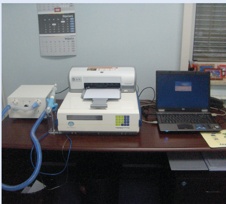
Slika 1. Aparat za mjerenje izdahnutog nitritova oksida s integriranim ultrazvučnim protočnim mjerčem (Analyzer CLD 88 sp)

upalnog odgovora. Frakcija izdahnutog NO koristi se kao biomarker u dijagnozi i praćenju bolesti, odnosno kao indikator uspješnosti liječenja u odraslih i djece koja boluju od astme. Iako su aparati za mjerenje izdahnutog NO značajni financij-