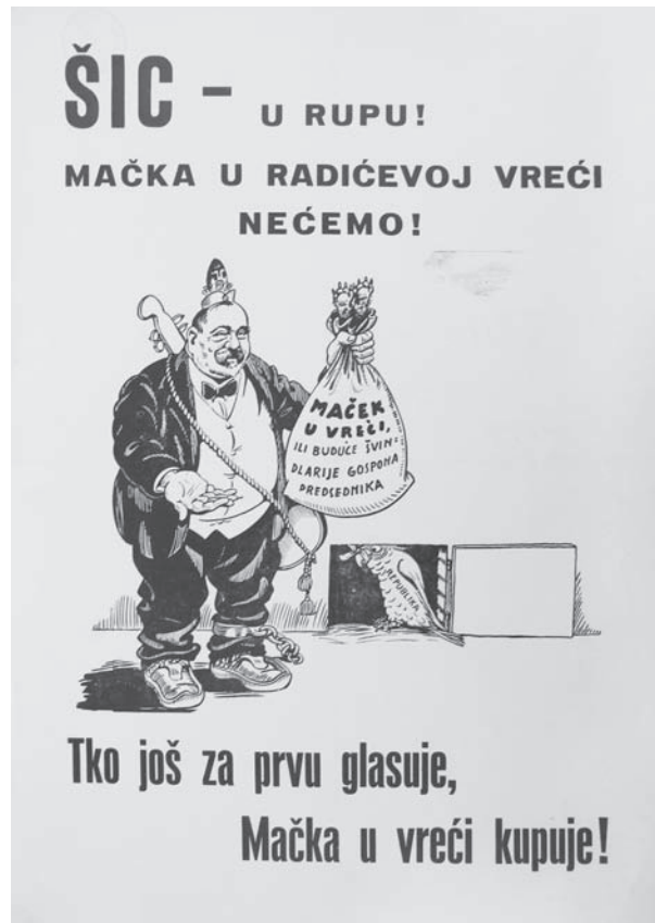
Jedan od plakata Hrvatskog bloka usmjerenih protiv HSS-a 41

će posljedica Radićevih oblasnih poreza (Peršić inzistira da je svota koju bi Zagrepčani trebali izdvojiti 27 milijuna dinara) biti preseljenje zagrebačke industrije u Beograd i gospodarsko uništenje Zagreba. 40