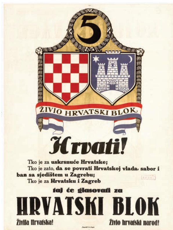
Plakat Hrvatskog bloka 49