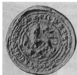
Sl. 2. Pečat krčkoga kneza Stjepana na po- velji od g. 1365.

Pečat kneza Stjepana (sl. 2) veoma je nejasan, jer se je kod otiskavanja bio pomaknuo i dva puta otisnuo. Prikazan je na desno okrenuti lav sa kacigom na glavi, kako davi neko zvijere, valjda vuka. Na kacigi je frankapanska zvijezda. Po čitanju prof. Brunšmida glasi napis: † S(igillum) Step(hani) com(itis) Seg(ne), fil(ii) co(mitis) Bartolomei.