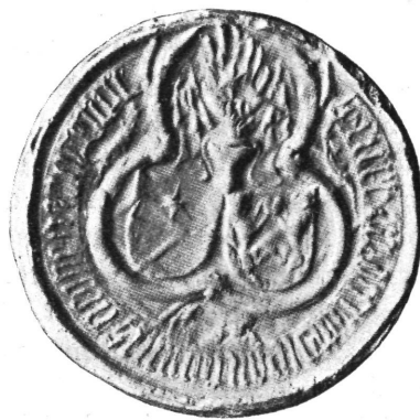
Sl. 5. Pečat knez Martina Frankapana († 1479).

znatno od pečata krčkih knezova u 14. stoljeću. Na njem nalazimo dva grba: onaj s desna je stari grb, naime štit razdijeljen na dva polja i sa zvijezdom u gornjem polju; drugi, lijevi grb sastoji od štita, na kojem su dva lava, kako lome hljebove. Dujam IV. Frankapan imade na svojem pečatu uz stari grb krčkih knezova također onaj grb s lavovima, za koji Vinciguerra kaže, da ga je papa Martin V. podijelio njegovu ocu, banu Nikoli.