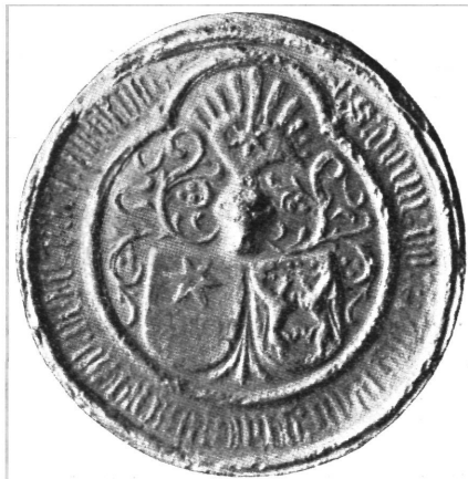
Sl. 4. Pečat kneza Dujma IV. Frankapana od god. 1452.

snimljen s jedne povelje od g. 1452. Posve jednaki pečat čuva se u arheološkom muzeju u Zagrebu (slika 4). Pečat kneza Dujma Frankapana razlikuje se