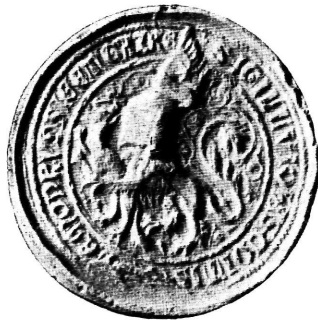
Sl. 1. Pečat krčkoga kneza Ivana na povelji od g. 1365.

1. U zemaljskom arhivu imade jedna izvorna povelja krčkih knezova Ivana i Stjepana od g. 1365, kojom vraćaju divinskomu knezu Hugonu „ terram et castrum Fluminis “, koje bijaše još otac njihov Bartol u zalog primio. Na toj povelji vise dva pečata, jedan veći kneza Ivana i jedan manji kneza Stjepana. Naša slika 1 prikazuje fotografski snimak pečata kneza Ivana.