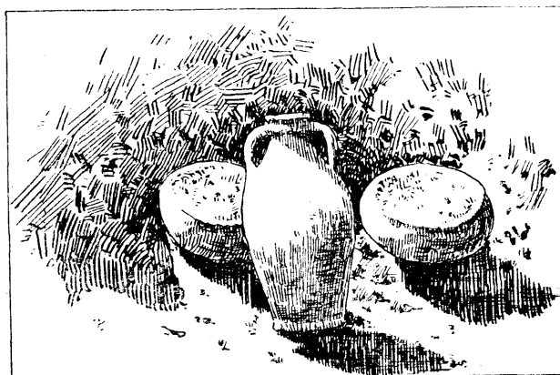
Sl. 65. Položaj posuda u grobu br. 64.