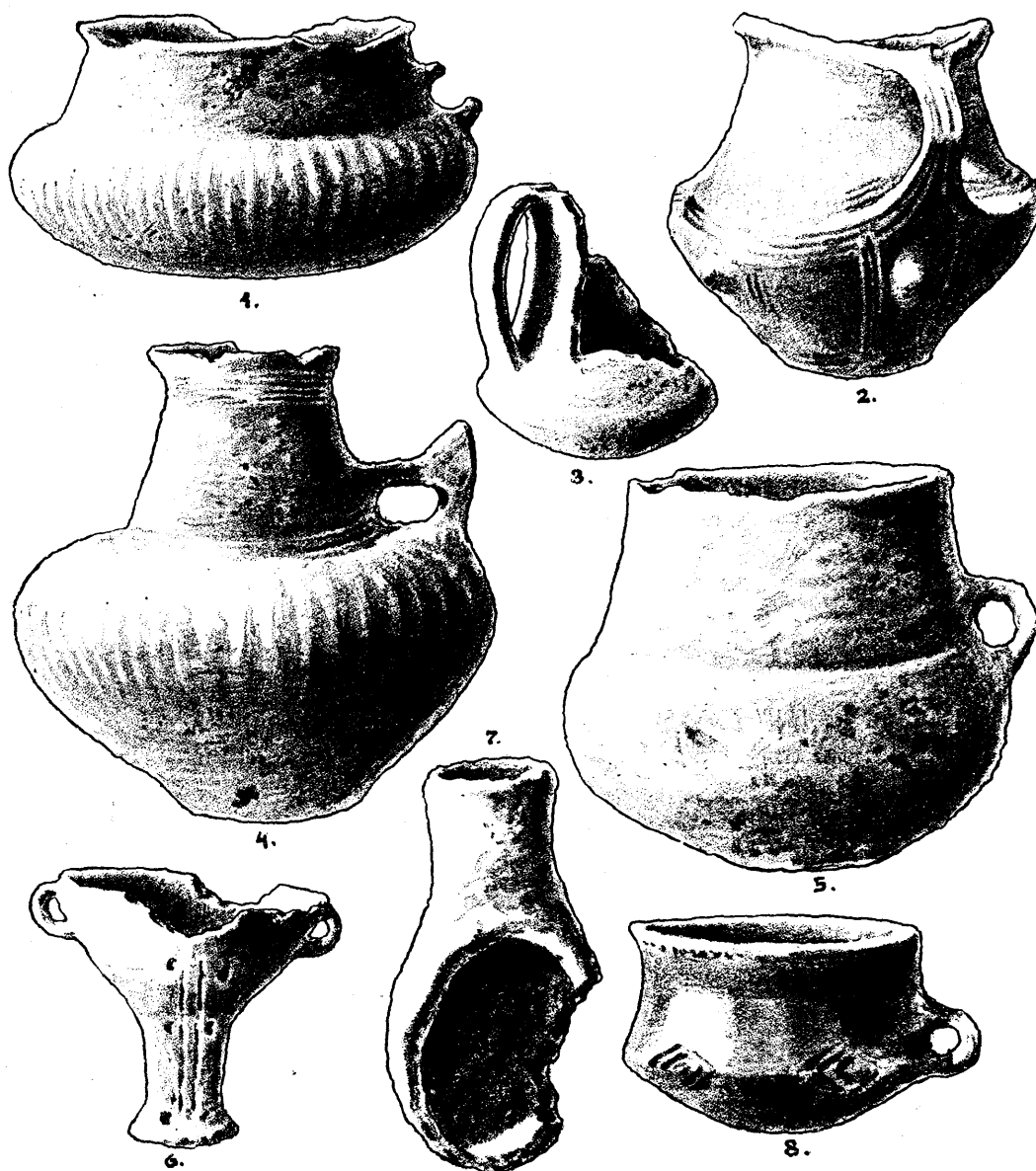
Sl. 125. Zemljano posuđe iz Erduta. \frac{1}{8} nar. vel.

osim toga je ispod gornjega ruba u okolo vijenac; visina 0 075 m. (sl. 125., 8). 2. Posuda po obliku kao br. 1. ali veća; odbijena ručka i komad gornjega dijela, sredinom u okolo ornamenat geometrijski sa uloženom bijelom zemljom, na gornjem rubu u okolo vijenac; visina 0 105 m. 3. Malena ornamentovana posudica sa dvije probušene bočkice, od kojih jedna odbijena, jer je