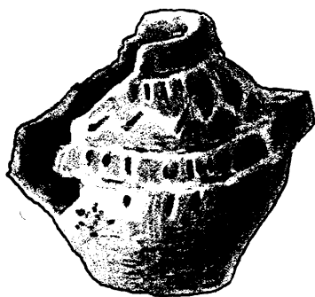
Sl. 126. Neolitička zemljana posudica iz Erduta. Nar. vel.

0·065 m. i 0·05 m. (Isporedi dr. Brunšmid o. c. str. 54. sl. 47. tom razlikom, da je u ove posudice bila ručka na duljoj strani). 22. Zemljana čaška cilindričnog oblika sa dvije neznatne probušene bočkice na gornjem rubu, vis. 0·075 m., promjer dna 0·035 m., promjer zjala 0·03 m. 23. Ornamentovana ručka veće posude, mjeri u duljinu 0·05 m., promjer šupljine 0·03 m. (glede oblika i ornamentike i radnje isporodi dr. M. Hoernes o. c. str. 269. sl. 5.).