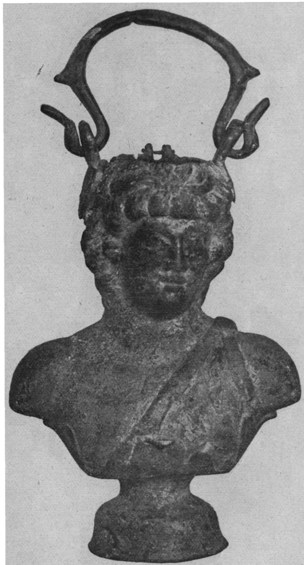
Sl. 10. a Bronsana posuda nađena u jednom rimskom grobu u Kostolcu (sprijeda).

Preko prsiju i leđa prebačena je panterova koža, koja ide preko lijevoga ramena, gdje je vezana. Na predstavljenoj panterovoj koži naročito su cizelovane dlake. Desna strana prsiju i leđa ostala su naga, te je kontrast između glatkoga tijela satira i panterove kože naročito istaknut tom predstavom dlaka.