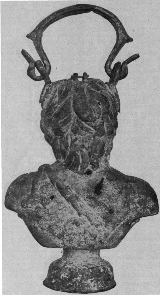
Sl. 10. b Bronsana posuda nađena u jednom rimskom grobu u Kostolcu (straga).

Gornji dio glave odrezan je, te ima kružan otvor, na čijoj se zadnjoj strani nalazi naprava za utvrđivanje poklopca na sudu (šarnir). Čivija, oko koje se poklopac okretao, još je očuvana. — Da bi se sud lakše i ugodnije mogao nositi, nalazi se na njemu jedno vrjeslo u obliku luka, čiji se krajevi završuju