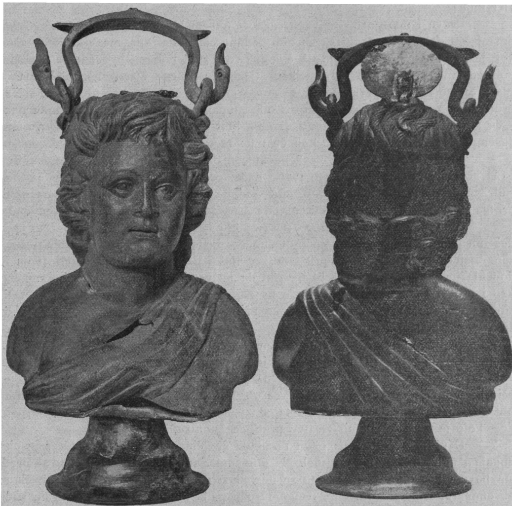
Sl. 11. a i b Rimska bronsana posuda iz Vinkovaca (sprijeda i straga).

Daleko je važnije od samoga datovanja pitanje: da li ovaj naš sud valja smatrati kao strani import u Viminacium, ili je on produkt lokalne industrije