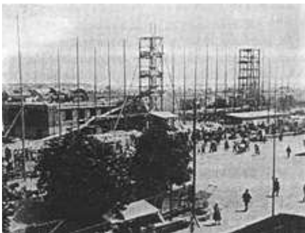
Slika 3. Početak gradnje novoga Veterinarskog fakulteta godine 1939. u današnjoj Heinzelovoj ulici u Zagrebu