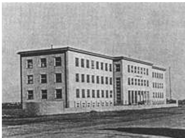
Figure 5. Main building of Veterinary faculty was finished in September, 1940 in Heinzelova street in Zagreb