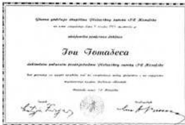
Slika 6. Predsjednik Hrvatskoga pčelarskog saveza

Akademik Tomašec nije se ograničio samo na nastavni i znanstveni rad na Veterinarskom fakultetu nego je bio aktivan i u našim stručnim i znanstvenim organizacijama. Već smo istaknuli njegov rad kao tajnika i predsjednika Hrvatskoga veterinarskog društva, a dodajemo da je bio i predsjednik Ihtiološkog društva te osnivač i dugogodišnji predsjednik, a zatim i doživotni počasni predsjednik Hrvatskoga pčelarskog saveza (Slika 6).