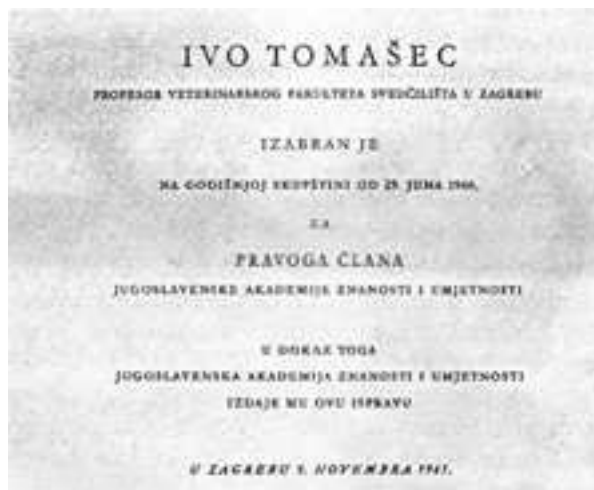
Slika 2. Akademik Tomašec izabran za redovnoga člana JAZU Figure 2. Academic Tomašec was elected for the member of JAZU

odlukom Sveučilišnoga senata osnovan Zavod za biologiju i patologiju riba i pčela, njegovo uređenje i vođenje povjerio je Fakultet Ivi Tomašecu. Godine 1940. izabran je za izvanrednog, a 1943. za redovnog profesora. Bio je predstojnik Zavoda od njegova osnutka pa sve do odlaska u mirovinu 1. siječnja 1974. Svoje znanje iz veterinarske mikrobiologije i bolesti pčela i riba usvršavao je u tada najvažnijim institucijama iz tog područja u Berlinu, Bernu, Alfortu, Parizu i Münchenu. Više od 250 objavljenih radova i desetak knjiga jasno pokazuju veliku publicističku aktivnost akademika Tomašeca. Već godine 1949. Akademija znanosti i umjetnosti izabire ga za suradnika, 1952. postaje dopisnim članom, a 1960. izabran je za redovnoga člana Akademijina Odjela za medicinske znanosti (Slika 2).