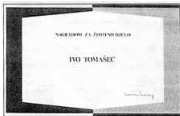
Slika 8. Nagrada za životno djelo Figure 8. Life reward

kongresu u Varšavi 1979. na skupštini Unije akademik Tomašec izabran je među prvima za počasnoga člana Unije kao istaknuti znanstvenik na polju razvoja ihtiologije.