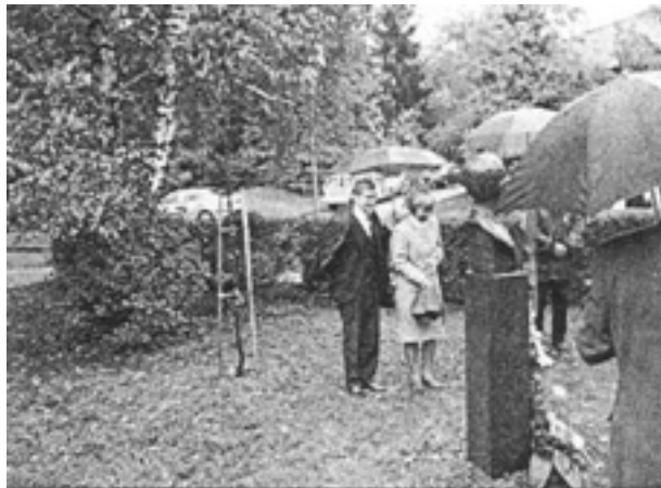
Slika 1. Bista akademika Tomašeca u memorijalnom parku u Novom Marofu