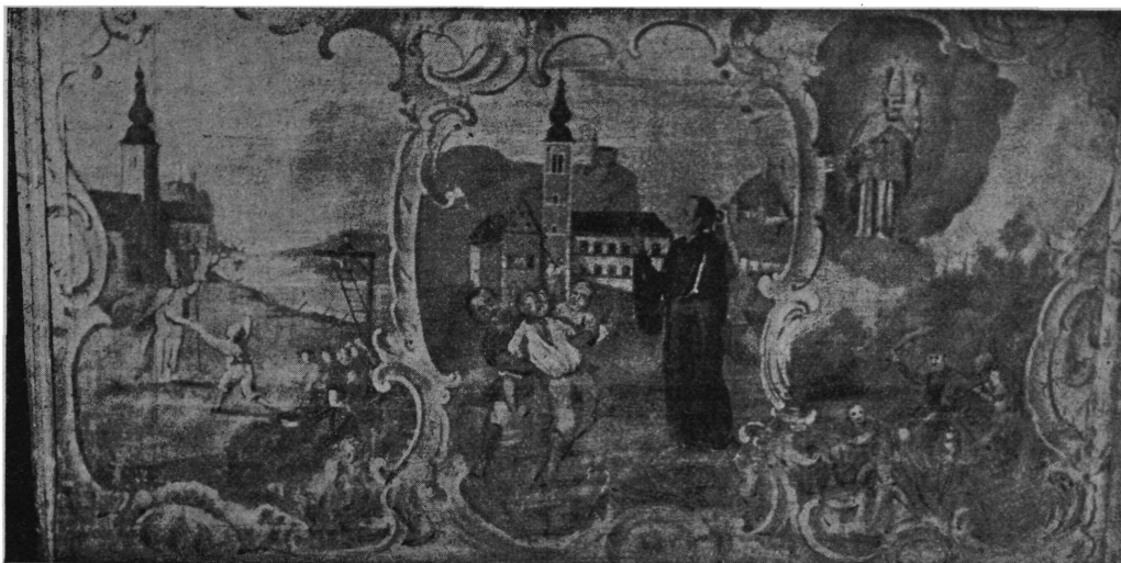
Sl. 2. Antependij na oltaru sv. Josipa u franjevačkoj crkvi u Krapini.

Kapelici sv. Josipa nema danas na brdu ni najmanjega traga. G. 1904. iskopao sam tek nešto klesanoga kamenja na onome mjestu, gdje je nekad stajala. Ne bi znali, ni gdje je bila, da nije na antependiju žrtvenika sv. Josipa u franjevačkoj crkvi sačuvana slika njezina. Na srednjem polju priloženoga snimka (Sl. 2.) vidimo najprije franjevački samostan s crkvom sv. Katarine; više te crkve uzdiže se brdo sv. Josipa s kapelom istoga imena. Nasuprot brdu i kapeli prikazuje se stari grad Krapina, kako ga je inače vrlo nespretni slikar kušao re-staurirati. Za gradnju kapele sv. Josipa nedvojbeno su upotrebili mnogo kamenja od nekadanjega grada na visočini brda.