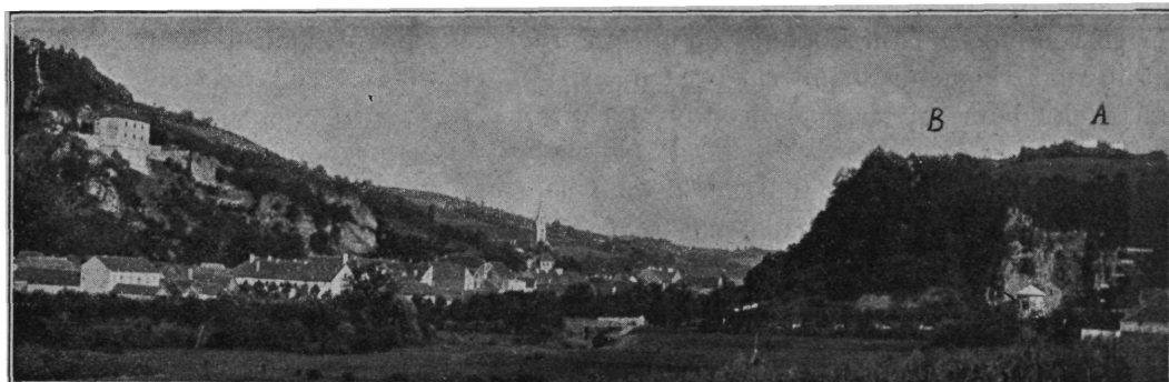
Sl. 1. Ruševine grada Krapine i brdo sv. Josipa. Lijevo na brijegu ostaci grada Krapine, desno brdo sv. Josipa. Kod A su ruševine staroga grada (Psari?), kod B stajala je kapelica sv. Josipa.

Da ogledamo to brdo sv. Josipa potanje. Ono je nešto niže od brda, na kojem je ostatak Krapine, a uzdiže se baš nasuprot tomu gradu uza zapadni (desni) brijeg rijeke Krapinice. Čuo sam pričati od tamošnjih žitelja, da je grad Krapina bio nekad spojen s gradom na brdu sv. Josipa kožnatim mostom! Prema sjeveru i istoku ruši se brdo sv. Josipa strmo, te se prikučuje Krapinici tako, da ono i brdo grada Krapine tvore tu u dolini kao neki tjesnac. Prema jugu i zapadu hvata se brdo sv. Josipa drugih, viših brda. Među inim drži se na sjeverozapadu znamenitoga brijega Hušnjakova, gdje je prof. dr. Gorjanović otkrio ostatke krapinskoga paleolitičkoga čovjeka. Na jugozapadnom podnožju brda sv. Josipa stoji samostan Franjevac sa crkvom sv. Katarine, osnovan g. 1639—1641.