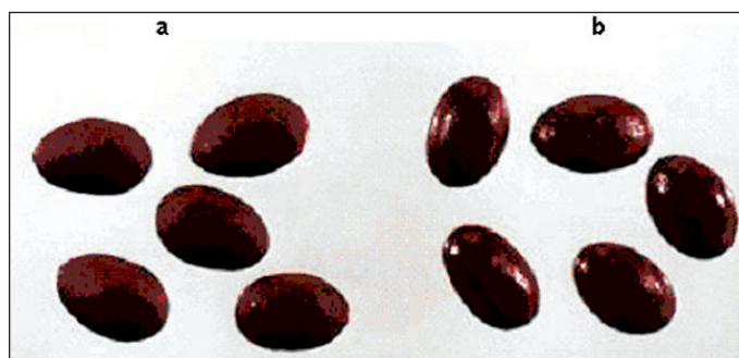
Slika 1. Konditorski proizvod a) bez prevlake b) s prevlakom izolata proteina sirutke

Prednosti primjene jestivih zaštitnih filmova u odnosu na nejestive filmove su: (i) jestivi film se konzumira (ii) troškovi su relativno niski, (iii) njihovom upotrebom smanjuje se udio otpadnog materijala čime se doprinosi zaštiti okoliša, (iv) mogu poboljšati ne samo organoleptička svojstva hrane, već i mehanička ili nutritivna svojstva, (v) pružaju zaštitu pojedinačnim manjim