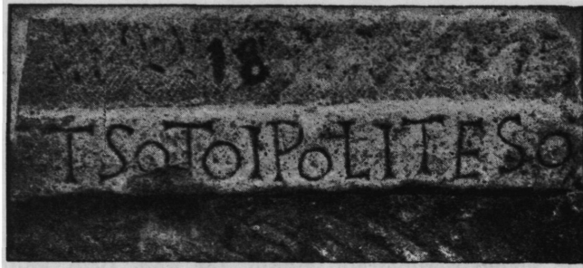
Sl. 2. Prag s natpisom iz ruševina crkvice Sv. Petra kod Babinduba. Sada u općinskoj zbirci u Biogradu na moru.

postavljene rastavne točke, koje je lapicida uzeo kao ukras. Mi smo ih jednostavno kušali ispuštiti i natpis je odmah postao shvatljiviji. Popunjujući ga dobivamo slijedeće čitanje: et s(anc)ti P(au)li te(mplum) s(acratum) . Ali i za odbijeni dio praga nijesmo već u neprilici da ga popunimo po smislu. Spojna