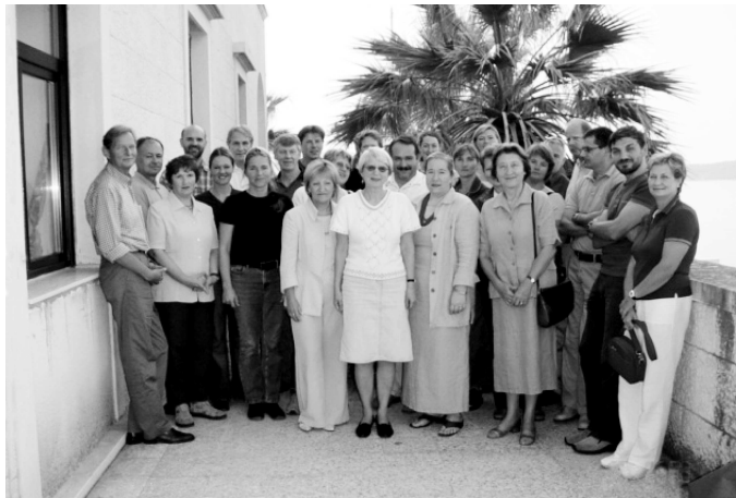
Figure 4. The participants of the Croatian-Norwegian workshop visiting the Institute