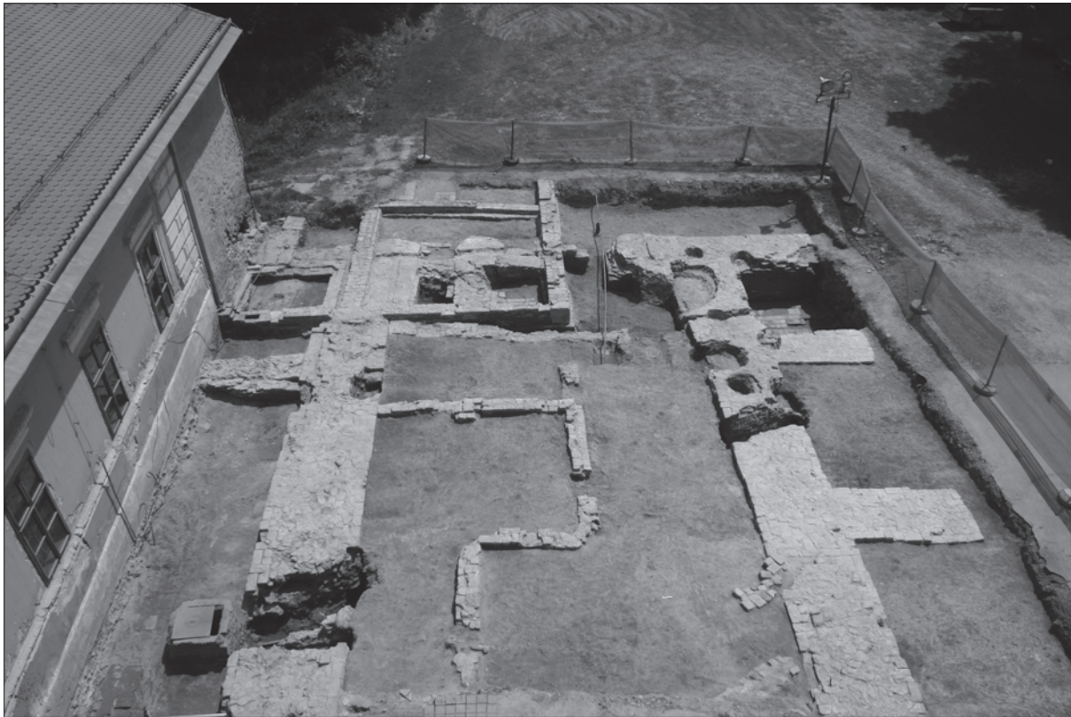
Sl. 1. Pogled na ulazni objekt