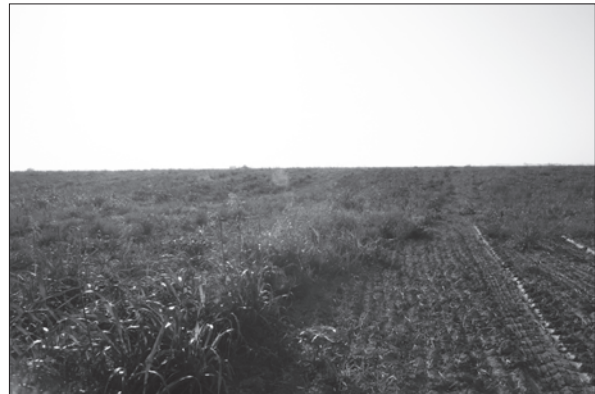
Sl. 3. Pogled sa zapada na položaj Novi Čeminac – Ćemin

Fig. 2 Remains of recent walls in the western trench of the cadastral unit 3497/3 at the Novi Čeminac-Ćirina ada site