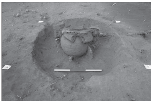
Sl. 2. Grob 24

Na osnovi tipološko-kronološke analize keramičkih posuda, grobovi se pripisuju mlađoj fazi kulture polja sa žarama, odnosno prijelazu na starije željezno doba. To je vrijeme kada se na prostorima istočne Slavonije i Baranje rasprostire skupina Dalj (Vinski-Gasparini 1973, 158-164), ali s obzirom na slabu istraženost podravskog prostora, nije poznata njezina zapadna granica. U Podravini je zabilježeno tek nekoliko nalazišta iz tog vremena, pri čemu se uglavnom radi o naseljima: Nova Bukovica (Kovačević 2001), Delovi-Grede I (Marković 1982), Delo-