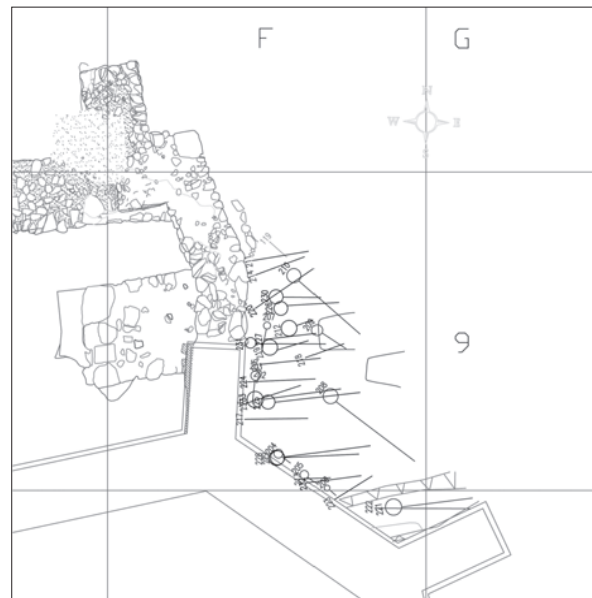
Sl. 2. Crkvari - Sv. Lovro, tlocrt položaja grobova istraženih 2008. g. (tanko sivo-novi vijek, crno-srednji vijek, i ukop SJ 728) (crtež: T. Tkalčec)

Fig. 2 Crkvari-St. Lawrence, ground-plan of the situation of graves excavated in 2008 (thin gray – New Era, black – Middle Ages, and burial SU 728) (illustration: T. Tkalčec)