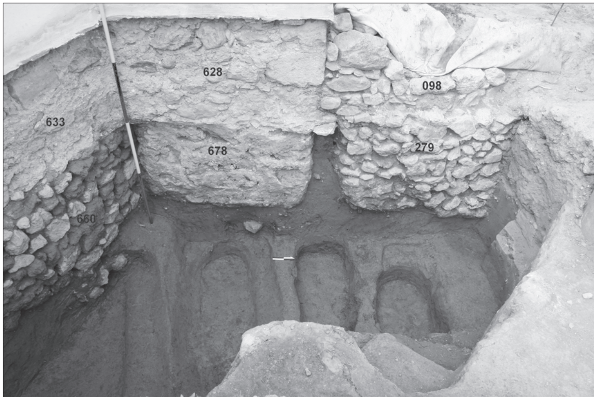
Sl. 3. Crkvari - Sv. Lovro, temelji svetišta i kontrafora te dozidana sjeverna sakristija (desno); dolje ukopi raka grbova = dno iskopa (s lijeva na desno): G 232 (i gornji G 229), G 233 (i gornji G 225), G 231, G 230