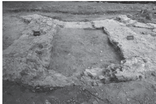
Sl. 5. Crkvari - Sv. Lovro, pogled na zvonik s istoka

Istraživanjima na zapadu cilj je bio otvoriti veću površinu na osnovi koje bi se dobio uvid u opću sliku lokaliteta. Stoga je plitko skinut humus, zabilježeni su donji slojevi i uglavnom se definirao tlocrt arhitekture. Ispostavilo se da je to bila odlična odluka jer smo na taj način definirali funkciju zida SJ 006 i objekta s kontraforima kojeg je on zatvarao, a čija smo istraživanja započeli još 2003. g. Do sada se ostavljala otvorena mogućnost da je to samostanski kompleks, no ovogodišnja su