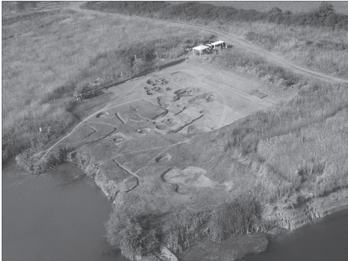
Sl. 1. Slavonki Brod, Galovo, zračni snimak arheološkog lokaliteta

Fig. 1. Slavonki Brod, Galovo, aerial photo of the archaeological site