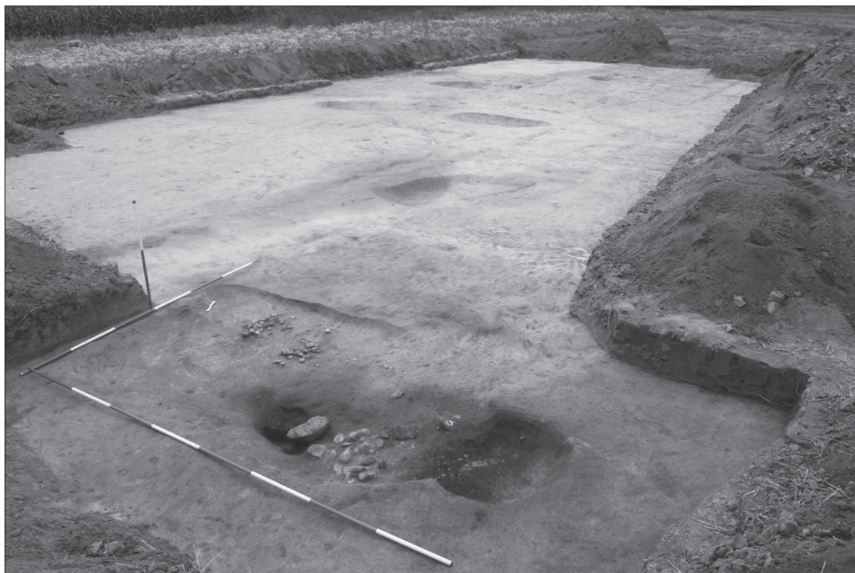
Sl. 2. Objekt SJ 096/097 i pogled na istraženi dio sonde S-6

Fig. 2 Structure SU 096/097 and view of the excavated part of trial trench S-6